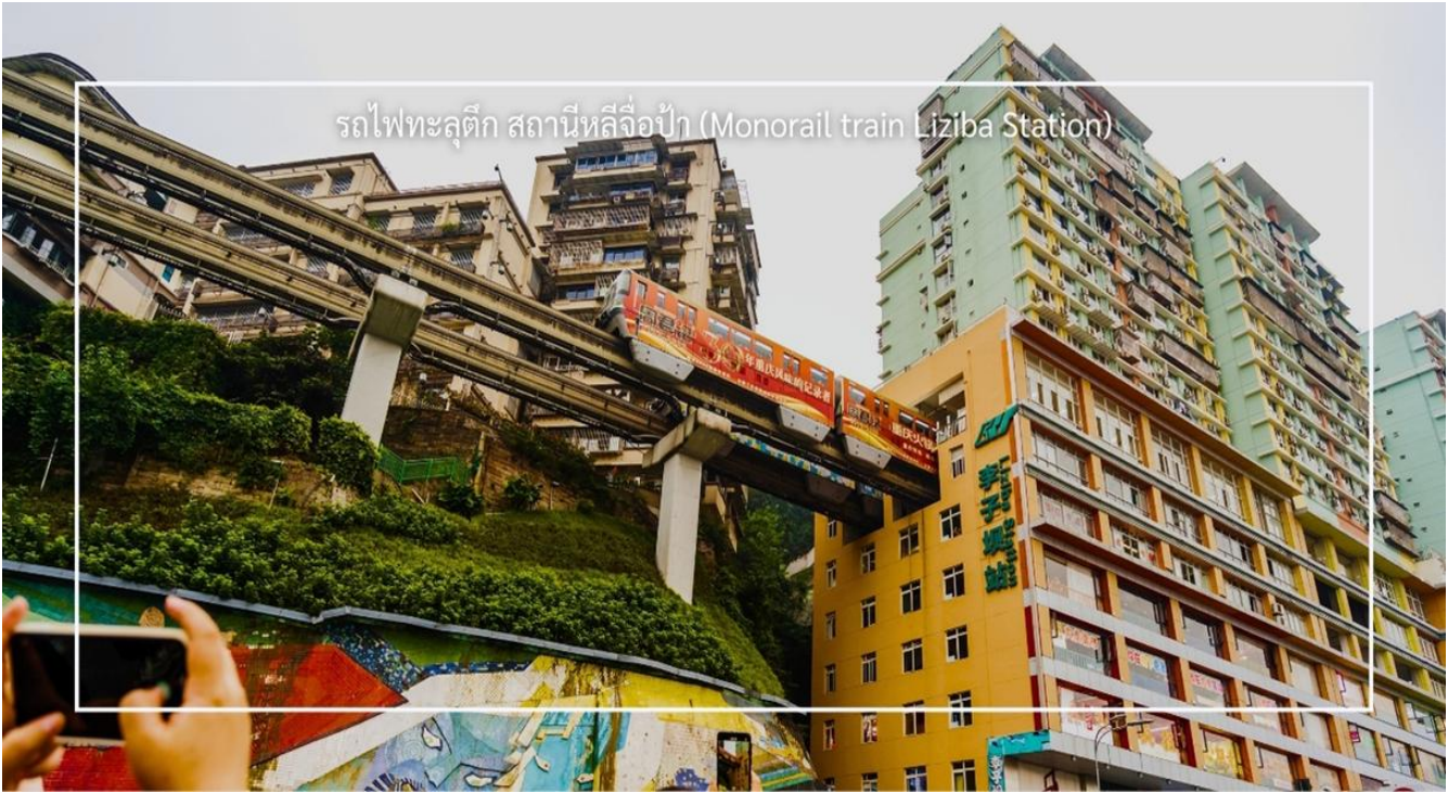
รถไฟทะลุติ๊ก สถานีหลี่จื่อป้า (Monorail train Liziba Station)

จากนั้นนำท่าน นั่งรถไฟทะลุติ๊ก (Monorail Train) หนึ่งในประสบการณ์ที่น่าสนใจและเป็นเอกลักษณ์ในเมืองฉงชิ่ง รถไฟเส้นนี้มีเส้นทางที่ผ่านอาคารและที่อยู่อาศัย ทำให้ผู้โดยสารรู้สึกเหมือนกำลังนั่งรถไฟที่ทะลุผ่านตึกสูง เส้นทางที่น่าสนใจในรถไฟนี้รวมถึงสถานีที่มีชื่อเสียง เช่น สถานีหลี่จื่อป้า (Liziba Station) ซึ่งตั้งอยู่ในพื้นที่ที่มีความหนาแน่นของประชากร การนั่งรถไฟทะลุติ๊กนี้เป็นวิธีที่ยอดเยี่ยมในการสัมผัสกับวัฒนธรรมเมืองฉงชิ่งและชื่นชมกับการพัฒนาเมืองที่น่าทึ่ง หากคุณมีโอกาสไปเยือนฉงชิ่ง อย่าลืมลองนั่งรถไฟเส้นนี้เพื่อสัมผัสประสบการณ์ที่ไม่เหมือนใคร