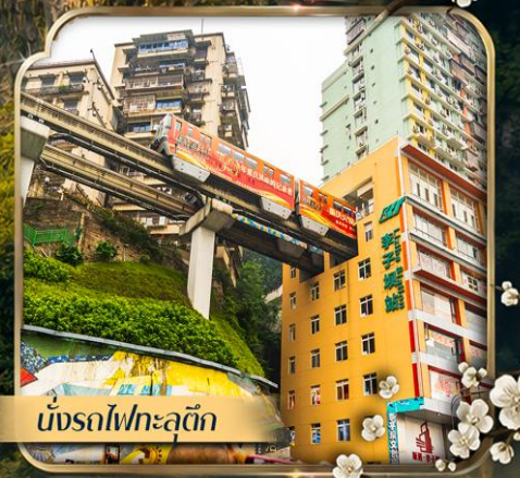
นั่งรถไฟทะเลตุ๊ก

คอนเฟิร์มออกเดินทาง ตั้งแต่วันที่ 10 ตำบล ขึ้นไป