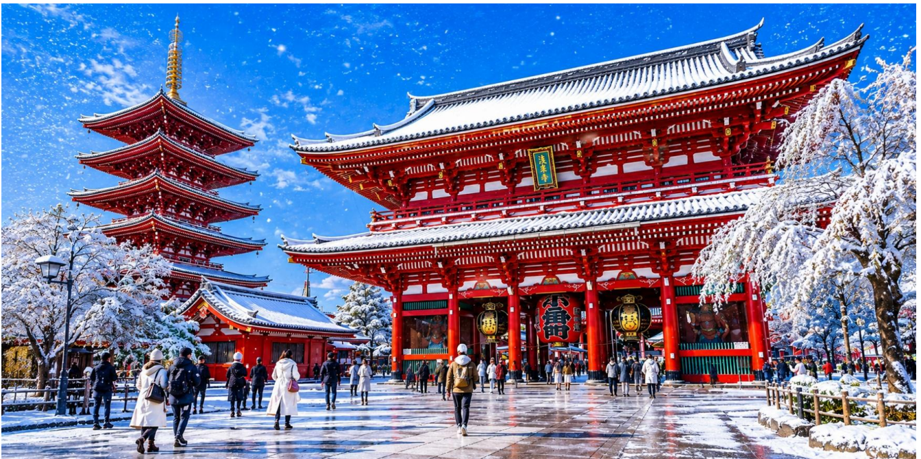
TF-NRTXJ02 โตเกียว ลานสกี ฟูจิเห็น หมู่บ้านโอชิโนะฮัคโค วัดอาซากุสะ (Freeday โตเกียวดิสนีย์แลนด์) 5วัน 3คืน บิน Air Asia X (XJ) หน้า 1 of 16

ตำนานเล่าขานว่า ในปี ค.ศ. 628 สองพี่น้องตระกูลฮิโนคุมะ ผู้ประกอบอาชีพประมง ได้ออกหาปลาบริเวณแม่น้ำสุมิเด แต่สิ่งที่ติดขึ้นมากับแหกลับไม่ใช่ปลา แต่เป็นองค์พระโพธิสัตว์คันนง เทพแห่งความเมตตา แม้ว่าทั้งสองจะพยายามนำองค์พระกลับไปปล่อยคืนสู่น้ำหลายครั้ง แต่ด้วยเหตุอัศจรรย์ พระโพธิสัตว์กลับปรากฏอยู่ในมือของพวกเขาเสมอ จนเกิดความศรัทธาอย่างแรงกล้า ชาวบ้านในละแวกนั้นจึงร่วมใจกันสร้างวัดขึ้นเพื่อประดิษฐานองค์พระและสักการบูชา นอกจากนี้ ยังมีเรื่องเล่าที่กล่าวถึง “มังกรทอง” ซึ่งปรากฏกายเลื้อยลงมาจากสรวงสวรรค์ในช่วงเวลาใกล้เคียงกับการค้นพบองค์พระโพธิสัตว์ จนกลายเป็นสัญลักษณ์แห่งความศักดิ์สิทธิ์และความเป็นสิริมงคลของวัดแห่งนี้ วัดอาซากุสะจึงได้รับความเคารพศรัทธาจากเหล่าโชกุน ซามูไร และประชาชนชาวญี่ปุ่นมาอย่างยาวนาน