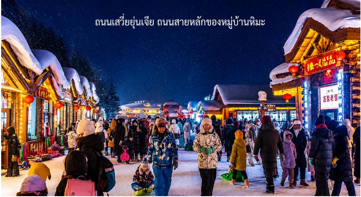
ถนนเสวี่ยยู่่นเจีย ถนนสายหลักของหมู่บ้านหิมะ

นำท่านเดินชมบรรยากาศบน ถนนเสวี่ยยู่่นเจีย ถนนสายหลักของหมู่บ้านหิมะ ที่เต็มไปด้วยร้านค้าของที่ระลึก ร้านอาหารท้องถิ่น และร้านกาแฟน่ารัก ๆ ถนนสายนี้ถูกตกแต่งด้วยไฟประดับและโคมแดงสไตล์จีน เพิ่มเสน่ห์ให้บรรยากาศอบอุ่น และมีชีวิตชีวาท่านสามารถช้อปปิ้งสินค้าท้องถิ่น หรือสินค้าแฮนด์เมด พร้อมถ่ายภาพเก็บความทรงจำในมุมสวย ๆ ของหมู่บ้าน ได้ตลอดทั้งคืน