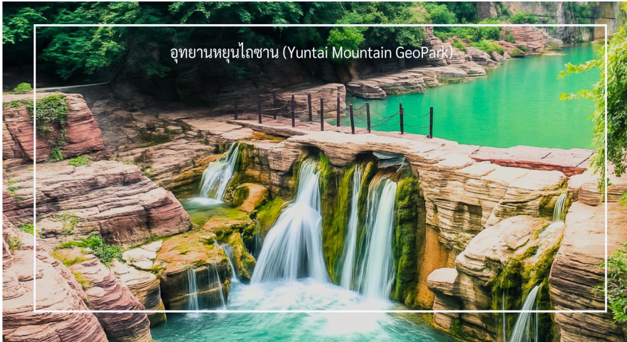
อุทยานหยุนไถซาน (Yuntai Mountain GeoPark)

เดินทางสู่ เมืองเต็งเฟิง ใช้เวลาเดินทางประมาณ 2 ชั่วโมง