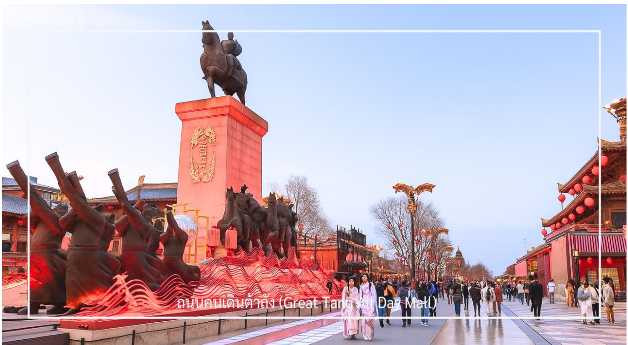
ถนนคนเดินต้าถัง (Great Tang at Dayan Temple)