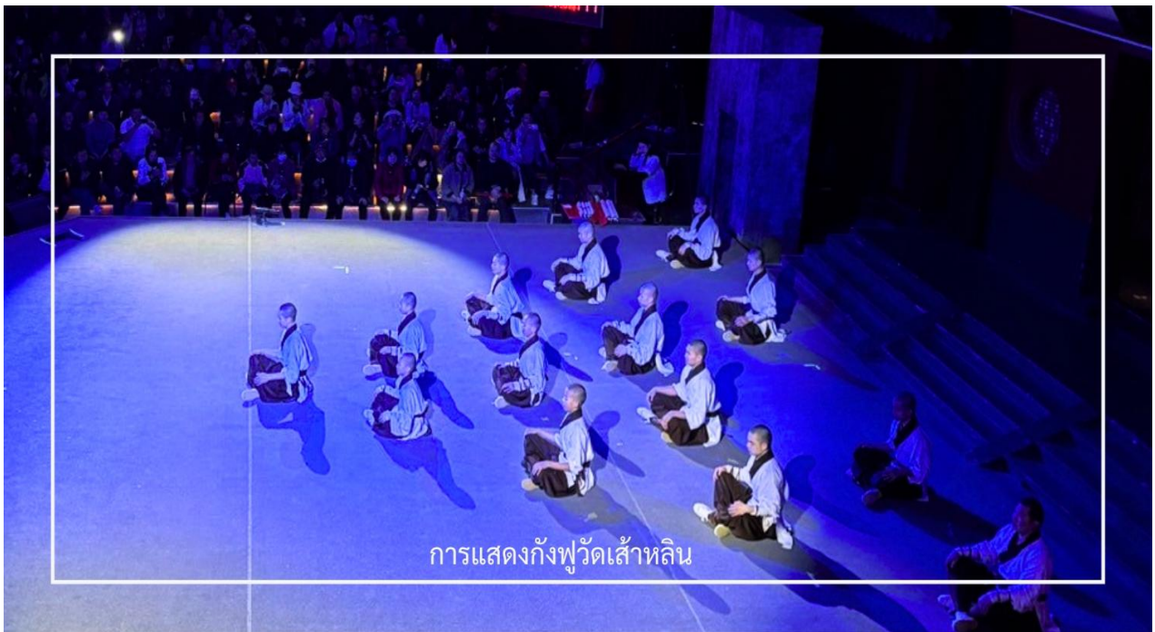
การแสดงกังฟูวัดเส้าหลิน

ไม่พลาด! กับประสบการณ์สุดพิเศษ ชมการแสดงกังฟูวัดเส้าหลิน ศิลปะการป้องกันตัวระดับตำนานที่เลื่องชื่อไปทั่วโลก การแสดงถ่ายทอดความแม่นยำ รวดเร็ว และแข็งแกร่งของวิทยายุทธเส้าหลิน ผ่านกระบวนการที่ได้รับความับันดาลใจจาก สัตว์นานาชนิด เช่น เสือ งู กระเรียน ผสานเข้ากับการตีลังกา หมุนตัว และการควบคุมร่างกายอันน่าทึ่ง ด้วยแสง สี เสียง และดนตรีประกอบฉากที่จัดเต็ม ทำให้โชว์นี้เต็มไปด้วยพลังและความเร้าใจ นอกจากนี้ ผู้ชมยังมีโอกาสได้มีส่วนร่วมบนเวที เพิ่มความสนุกสนาน และประทับใจไม่รู้ลืม