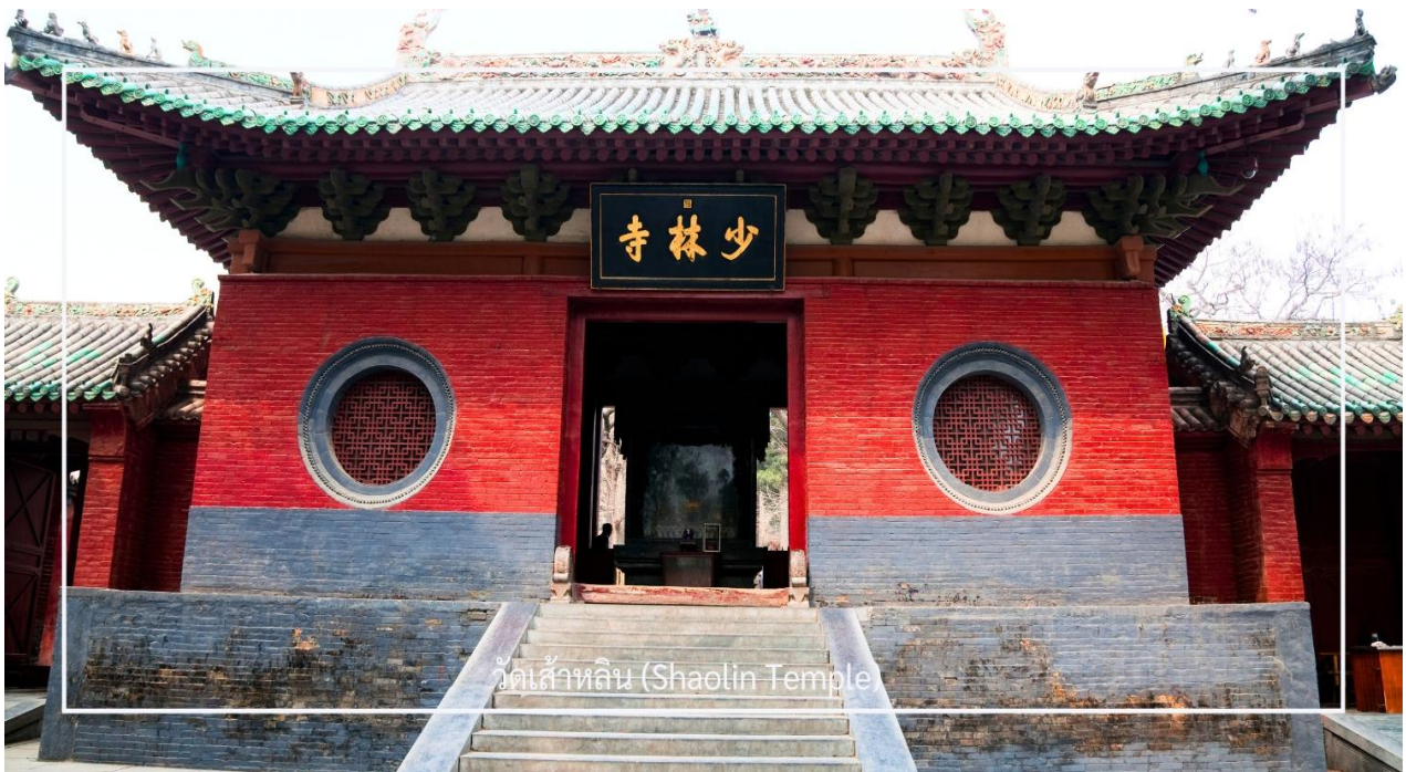
วัดเส้าหลิน (Shaolin Temple)

ไม่พลาด! กับประสบการณ์สุดพิเศษ ชมการแสดงกังฟูวัดเส้าหลิน ศิลปะการป้องกันตัวระดับตำนานที่เลื่องชื่อไปทั่วโลก การแสดงถ่ายทอดความแม่นยำ รวดเร็ว และแข็งแกร่งของวิทยายุทธเส้าหลิน ผ่านกระบวนการที่ได้รับความับันดาลใจจาก สัตว์นานาชนิด เช่น เสือ งู กระเรียน ผสานเข้ากับการตีลังกา หมุนตัว และการควบคุมร่างกายอันน่าทึ่ง ด้วยแสง สี เสียง และดนตรีประกอบฉากที่จัดเต็ม ทำให้โชว์นี้เต็มไปด้วยพลังและความเร้าใจ นอกจากนี้ ผู้ชมยังมีโอกาสได้มีส่วนร่วมบนเวที เพิ่มความสนุกสนาน และประทับใจไม่รู้ลืม