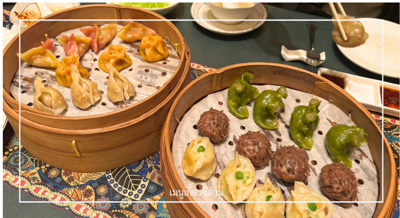
เมนูเกี้ยวซีอาน

พร้อมทั้งลิ้มรสเกี้ยวซีอาน อาหารท้องถิ่นชื่อดัง รสชาติจัดจ้านกลมกล่อม ซึ่งเป็นประสบการณ์ทางวัฒนธรรมและรสชาติที่ควรลิ้มลองสักครั้ง