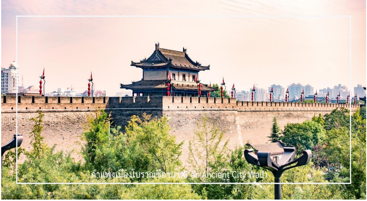
กำแพงเมืองโบราณซีอาน (Xi'an Ancient City Wall)

นำท่านขึ้นชม กำแพงเมืองโบราณซีอาน (Xi'an Ancient City Wall) อีกหนึ่งกำแพงเมืองโบราณเก่าแก่และสมบูรณ์ที่สุดของจีน สร้างขึ้นในสมัยราชวงศ์หมิงเมื่อกว่า 600 ปีก่อน มีความยาวโดยรอบประมาณ 13.7 กิโลเมตร กว้าง 12-14 เมตร และสูงราว 12 เมตร ออกแบบอย่างแข็งแกร่งเพื่อการป้องกันเมือง โดยมีป้อม ประตูเมือง และคูน้ำล้อมรอบ ปัจจุบันกลายเป็นแหล่งท่องเที่ยวยอดนิยม นักท่องเที่ยวสามารถเดินเล่นหรือปั่นจักรยานบนกำแพง เพื่อชมทัศนียภาพของเมืองซีอานทั้งภายในและภายนอกเขตกำแพงได้อย่างชัดเจน