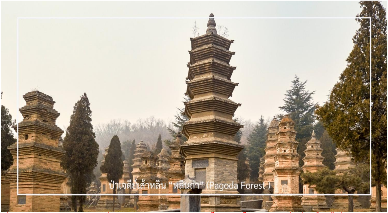
ป่าเจดีย์เส้าหลิน “หลินถา” (Pagoda Forest)

ภายในบริเวณเต็มไปด้วยเจดีย์หินจำนวนมากกว่า 240 องค์ ซึ่งบางองค์มีความสูงถึง 15 เมตร เจดีย์แต่ละองค์มีขนาดและรูปร่างแตกต่างกันไปตามยุคสมัย เช่น ทรงกลม ทรงสี่เหลี่ยม และทรงหกเหลี่ยม อีกทั้งยังประดับด้วยลวดลายแกะสลักอย่างวิจิตรงดงาม บางองค์มีจารึกที่บอกเล่าชีวประวัติของพระภิกษุผู้ได้รับการบูชาขึ้น ๆ