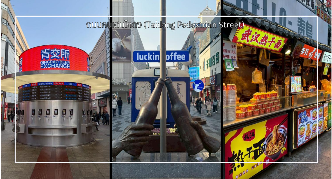
ถนนคนเดินไถตง (Taidong Pedestrian Street)

ถนนคนเดินไถตง (Taidong Pedestrian Street) ย่านการค้าขนาดใหญ่ใจกลางเมือง 칭เต่า (Qingdao) ที่คึกคักและเต็มไปด้วยสีสันแห่งชีวิตประจำวัน ถนนแห่งนี้เป็นแหล่งรวมสินค้าแฟชั่น แบรินด์ท้องถิ่น ร้านอาหาร คาเฟ่ และร้านของฝากมากมาย เหมาะสำหรับนักท่องเที่ยวที่ต้องการสัมผัสวิถีเมืองและเลือกซื้อของที่ระลึกกลับบ้าน พร้อมให้ท่านได้ อีสาระมื่ออาหารเย็น เลือกสรรกับร้านค้า Street food มากมาย