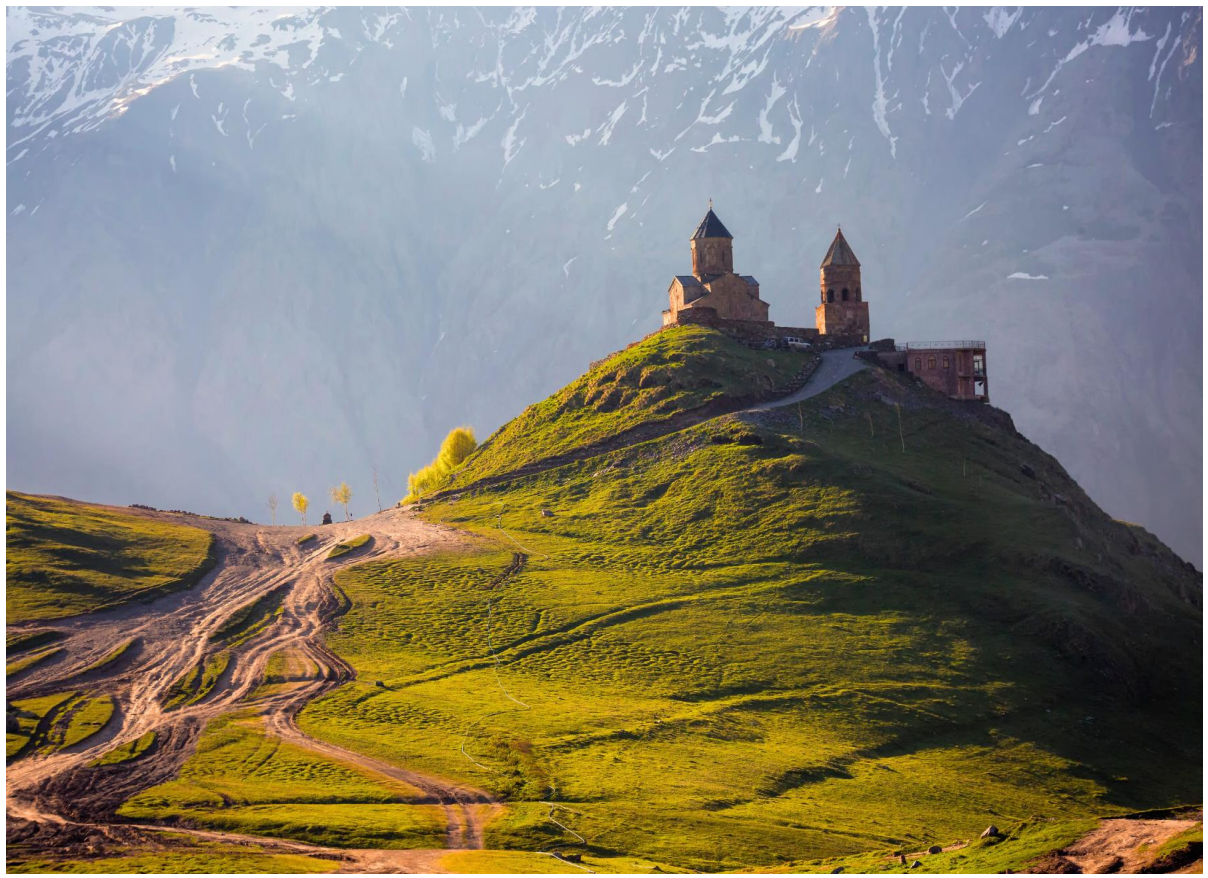
TF-TBSTK03 แกรนด์จอร์เจีย 8วัน 5คืน เทียวครบ คอเคซัส เข้าทบิลีซี-ออกบาตูมี ล่องเรือทะเลดำ Turkish Airlines (TK) Page 9 of 18

เที่ยง รับประทานอาหารเที่ยง ณ ภัตตาคาร (มื้อที่ 7) จากนั้นนำท่านเดินทางสู่ เมืองคاخเบกกี หรือชื่อปัจจุบัน สเตพานท์สมินด้า (Stepantsminda) เมืองเล็กในหุบเขาคอเคซัส ตั้งอยู่ริม แม่น้ำเทอร์จิกี (Tergi River) บนความสูงประมาณ 1,740 เมตรเหนือระดับน้ำทะเล เมืองคاخเบกกีโดดเด่นด้วย ธรรมชาติอันงดงามและอากาศบริสุทธิ์ โดยเฉพาะในฤดูร้อนที่เย็นสบาย นำท่านเปลี่ยนการเดินทางเป็น รถจี๊ป 4WD เพื่อไปชมความงดงามของ โบสถ์เกอร์เกตี (Gergeti Trinity Church) ซึ่งสร้างขึ้นใน ศตวรรษที่ 14 อีกชื่อที่นิยมเรียกคือ Tsminda Sameba โบสถ์ศักดิ์สิทธิ์แห่งนี้ตั้งอยู่บน ฝั่งขวาของแม่น้ำชคเฮรี (Chkheri River) และตั้งอยู่บนเทือกเขาของเมืองคاخเบกกี ถือเป็นหนึ่งใน ไฮไลท์ทางธรรมชาติและศาสนาของจอร์เจีย