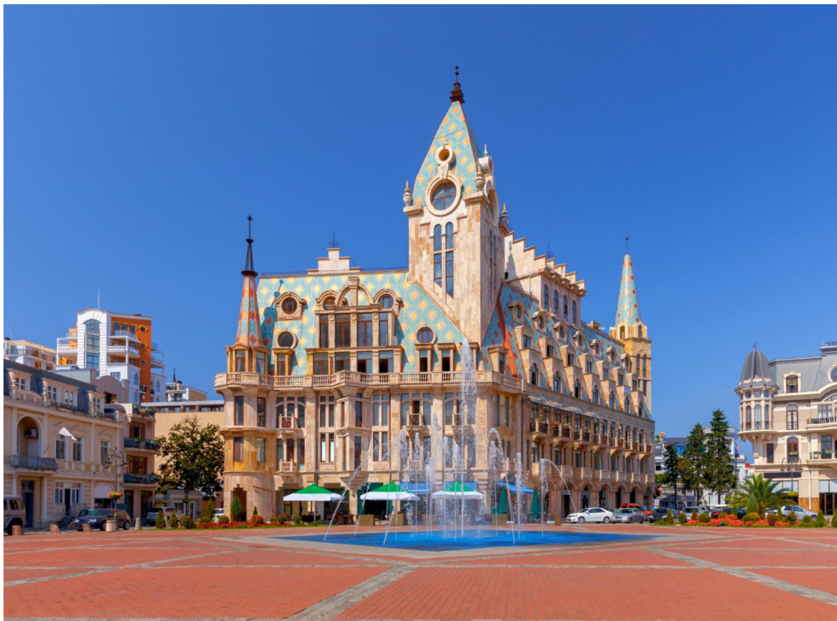
TF-TBSTK03 แกรนด์จอร์เจีย 8วัน 5คืน เทียวครบ คอเคซัส เข้าทบิลีซี-ออกบาตูมี ล่องเรือทะเลดำ Turkish Airlines (TK) Page 15 of 18

นำท่าน อีสรระข้อปั้งที่ Boulevard ถนนคนเดินและแหล่งช้อปปิ้งยอดนิยมของกรุงทบิลีซี ที่นี่เต็มไปด้วยร้านค้าแบรนด์ดัง ร้านบูติกเก๋ ๆ ร้านของที่ระลึก และคาเฟ่น่ารัก ๆ ให้ท่านเพลิดเพลินกับการเดินชม ชิม และเลือกซื้อสินค้าตามอัธยาศัย พร้อมสัมผัสบรรยากาศชุมชนท้องถิ่นและไลฟ์สไตล์ของชาวเมืองอย่างใกล้ชิด จากนั้นนำท่านชม จัตุรัสเปียเซซ่า (Piazza Square) หนึ่งในจัตุรัสยอดนิยมของกรุงทบิลีซี ตั้งอยู่ใจกลางเมืองเก่า เป็นแหล่งรวมคาเฟ่ ร้านอาหาร บาร์ และร้านค้าสไตล์ยุโรปที่มีเอกลักษณ์ โดดเด่นด้วยสถาปัตยกรรมผสมผสานแบบยุโรป-เมดิเตอร์เรเนียน และบรรยากาศที่เต็มไปด้วยชีวิตชีวา ท่านสามารถเดินเล่น ถ่ายภาพ หรือพักผ่อนกับเสียงดนตรีสด และชมกิจกรรมต่าง ๆ ของชาวเมือง ทำให้จัตุรัสแห่งนี้เป็นจุดนัดพบและแลนด์มาร์กสำคัญของเมือง