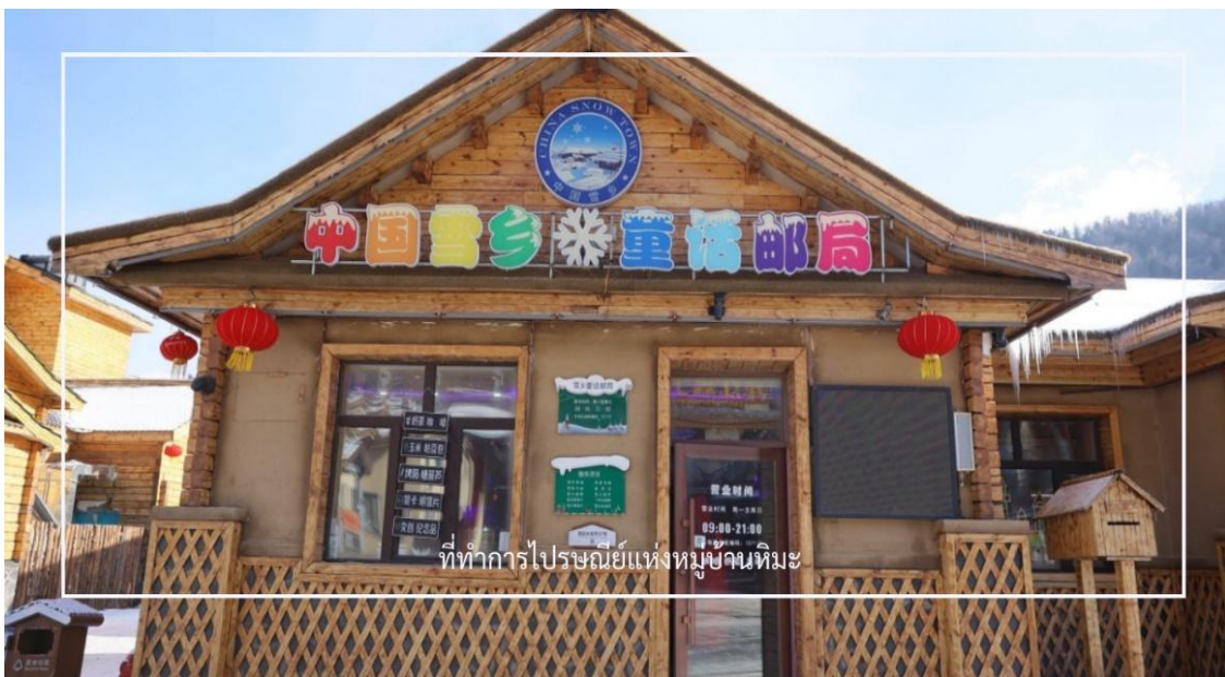
TF-HRBXJ07-ฮาร์บิน-หมู่บ้านหิมะ Xuexiang ภาพวาดสีปลี เทศกาลน้ำแข็งนานาชาติ 6 วัน 4 คืน บินตรง Thai AirAsia X #ทัวร์ไม่ลงร้าน Page 8 of 17

ชม พิพิธภัณฑ์แห่งหมู่บ้านหิมะ (Snow Town Museum) เป็นพิพิธภัณฑ์ที่รวบรวมประวัติ ความเป็นมา และวัฒนธรรมของหมู่บ้านหิมะ Xuexiang จัดแสดงเครื่องมือ อุปกรณ์ และวิถีชีวิตของชาวบ้านในพื้นที่หนาวจัด ที่ทำการไปรษณีย์แห่งหมู่บ้านหิมะ อีกหนึ่งจุดเช็คอิน ที่นี้ไม่เพียงเป็นไปรษณีย์ในพื้นที่ห่างไกล แต่ยังเป็นสถานที่ที่ทุกท่านสามารถเลือกซื้อโปสการ์ดลวดลายพิเศษ พร้อมส่งถึงคนที่รัก และประทับใจเฉพาะของหมู่บ้านหิมะ ที่ไม่มีจำหน่ายในทีใด อาคารไปรษณีย์หลังเล็ก สีเขียวเข้มตัดกับหิมะสีขาว เป็นอีกหนึ่งมุมถ่ายรูปยอดนิยม