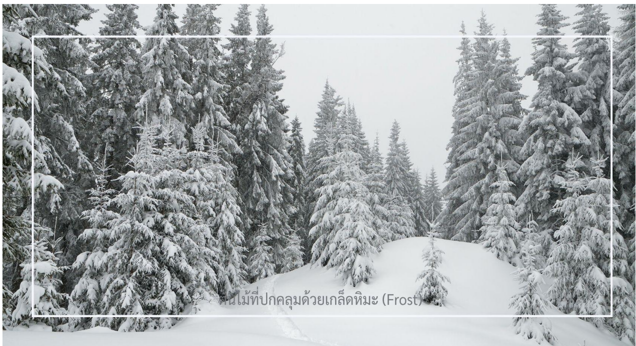
ต้นไม้ที่ปกคลุมด้วยเกล็ดหิมะ (Frost)

ยาบูลี (Yabuli) เมืองตากอากาศชื่อดังทางตอนเหนือของจีน ตลอดเส้นทาง ท่านจะได้เพลิดเพลินกับทัศนียภาพของฤดูหนาวที่งดงาม ราวกับฉากในนิยาย ท่ามกลางต้นไม้ที่ปกคลุมด้วยเกล็ดหิมะ (Frost) ระเบียบระย้าราวคริสตัล สองข้างทางแต่งแต้มไปด้วยหิมะขาวนวล เป็นบรรยากาศที่หาได้ยากและงดงามจับใจในแบบเฉพาะของดินแดนภาคตะวันออกเฉียงเหนือของจีน