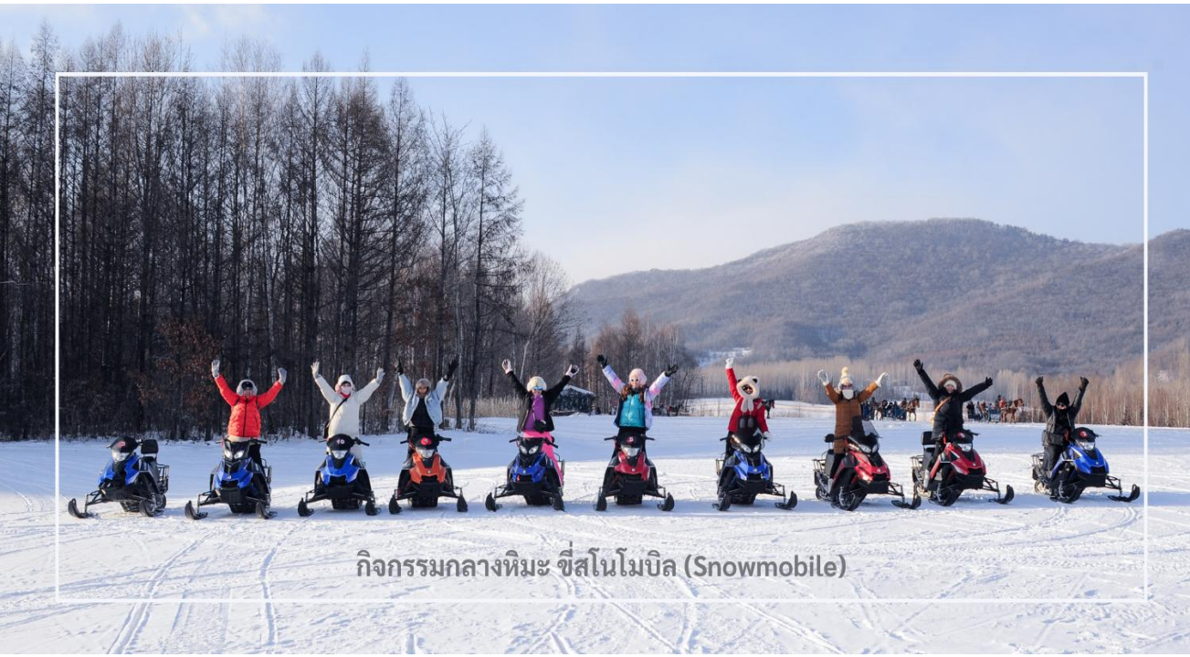
กิจกรรมกลางหิมะ ซีสนโมบิล (Snowmobile)

สมควรแก่เวลานำท่านเดินทางสู่เมือง มู่ตันเจียง (Mudanjiang) ใช้เวลาเดินทางประมาณ 2 ชั่วโมง มู่ตันเจียง เมืองสำคัญตั้งอยู่ใกล้พรมแดนรัสเซีย ห่างไปทางตะวันตกประมาณ 110 กิโลเมตร เมืองนี้มีเอกลักษณ์วัฒนธรรม และสถาปัตยกรรมที่ผสมผสานระหว่างรัสเซียและจีน โดยเฉพาะในฤดูหนาวเมืองจะถูกปกคลุมด้วยหิมะขาวโพลน