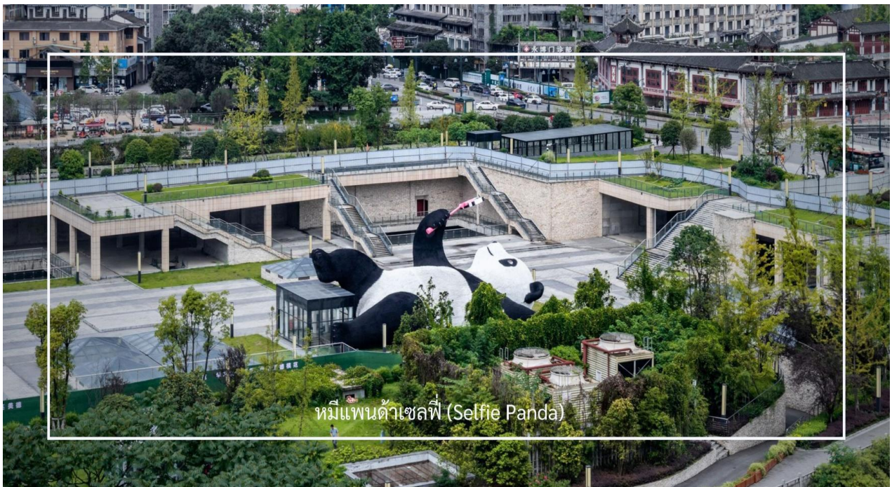
หมีแพนด้าเซลฟี่ (Selfie Panda)

เดินทางสู่อีก 1 จุดเช็คอิน ที่ไม่ควรพลาดของเมืองตูเจียงเยียน จัตุรัสหย่างเทียนวู (Yangtianwo Square) เป็นจุด ถ่ายรูปยอดนิยมซึ่งท่านจะได้ชมประติมากรรมรูปปั้น หมีแพนด้าเซลฟี่ (Selfie Panda) หมีแพนด้าตัวใหญ่ที่กำลังนอน หงายเซลฟี่ ณ ใจกลางจัตุรัสหย่างเทียนวู เป็นภาพแสนน่ารักที่อ่อนจนทำให้เราหลงไหลและไม่พลาดที่จะถ่ายรูปคู่เป็นที่ ระลึกกันเลยทีเดียว