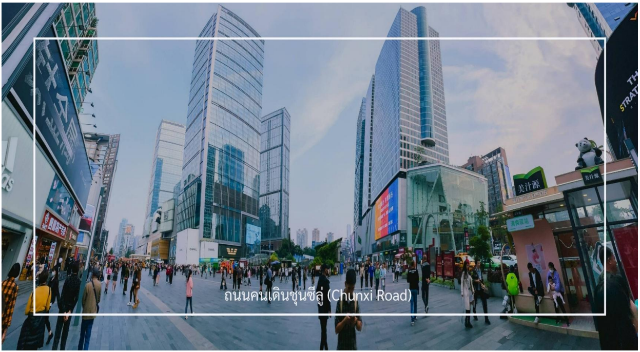
ถนนคนเดินชุนซี (Chunxi Road)

หลังอาหารเช้า นำท่านแวะชม ร้านสมุนไพวจีน แวะชมศูนย์จำหน่าย ผลิตภัณฑ์หยก แหล่งรวมเครื่องประดับและสินค้าคุณภาพ อาทิ กำไลข้อมือหยก แหวนหยก สร้อยคอหยก นำท่านช้อปปิ้ง ถนนคนเดินชุนซี (Chunxi Road) เต็มไปด้วยร้านค้าแบรนด์ชั้นนำทั้งในและต่างประเทศ รวมถึงร้านเสื้อผ้าแฟชั่น รองเท้า อุปกรณ์อิเล็กทรอนิกส์ และของฝาก ถนนคนเดินชุนซีเป็นจุดที่มีความคึกคักและเต็มไปด้วยผู้คน โดยเฉพาะในช่วงวันหยุดสุดสัปดาห์และเทศกาลต่างๆ คุณจะพบกับ การแสดงศิลปะ การแสดงดนตรี และกิจกรรมที่น่าสนใจ มีร้านอาหารมากมายที่เสนออาหารท้องถิ่นและขนมหวานที่หลากหลาย นักท่องเที่ยวสามารถลิ้มลองเมนูพื้นเมืองที่อร่อย เช่น เสี่ยวหลงเปา (ซาลาเปานึ่ง) เที่ยง