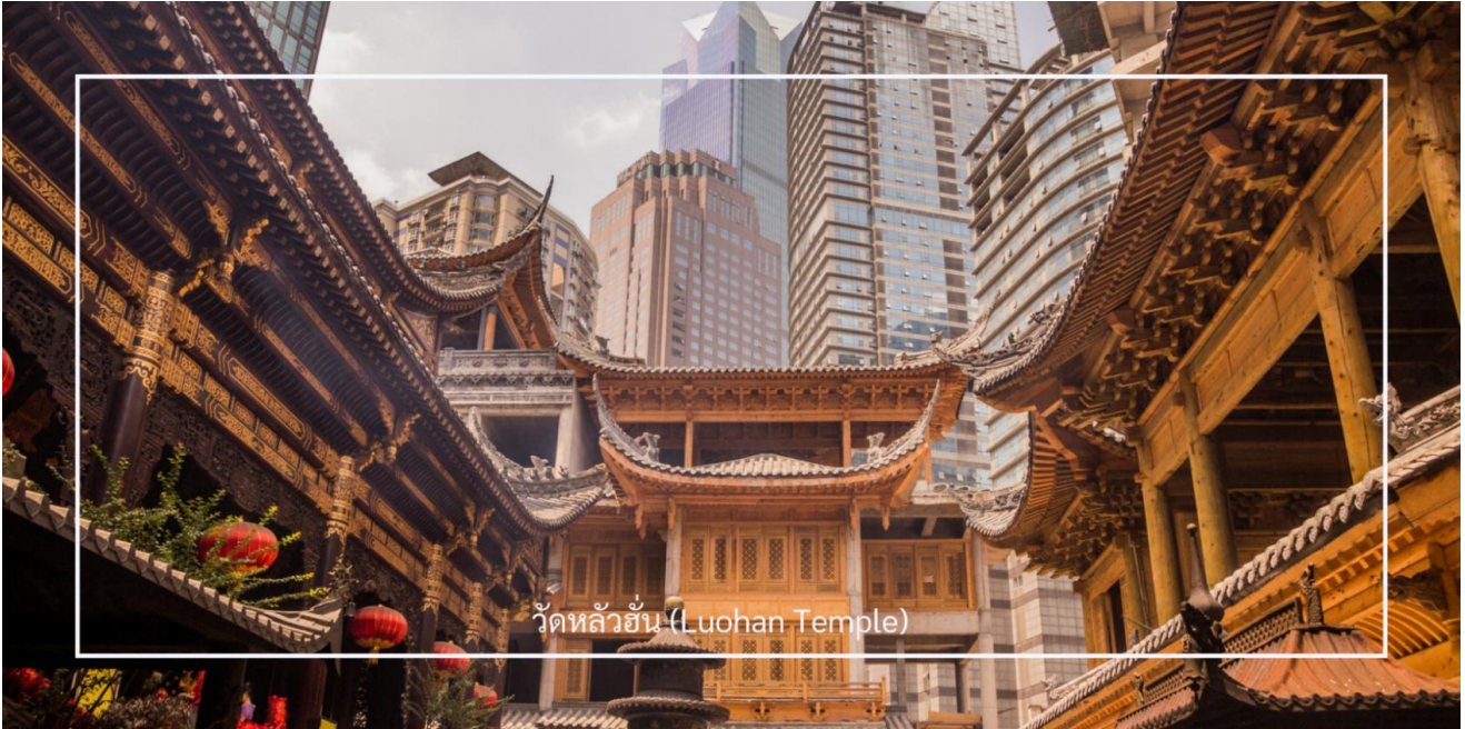
วัดหลัวฮั่น (Luohan Temple)

นำท่านเที่ยวชม วัดหลัวฮั่น (Luohan Temple) หรือที่เรียกว่า "วัดอรหันต์" เป็นวัดที่มีชื่อเสียงในเมืองฉงชิ่ง มีประวัติศาสตร์ยาวนานและมีความสำคัญในด้านศาสนาพุทธ วัดหลัวฮั่นมีพระพุทธรูปและรูปปั้นอรหันต์จำนวนมาก ซึ่งเป็นที่เคารพนับถือของผู้มาเยือน นอกจากนี้ยังมีบริเวณที่ให้ผู้เข้าชมสามารถทำบุญและสวดมนต์