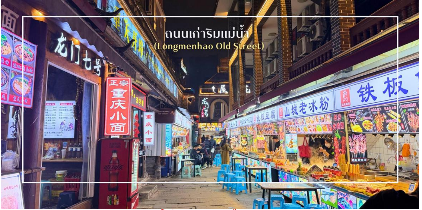
ถนนเก่าริมน้ำ (Longmenhao Old Street)

เย็น บริการอาหารเย็น ณ ภัตตาคาร (มื้อที่ 9) เมนูพิเศษ : สุกี้หม่าล่า สมควรแก่เวลา นำท่านเดินทางสู่ ตลาดหงยาตั้ง (Hongyadong) หรือที่เรียกว่า "Hongya Cave" เป็นสถานที่ท่องเที่ยวที่มีชื่อเสียงในเมืองฉงชิ่ง โดยตั้งอยู่ริมแม่น้ำแยงซี มีบรรยากาศที่เต็มไปด้วยวัฒนธรรมและประวัติศาสตร์ ตลาดหงยาตั้งเป็นพื้นที่ที่มีอาคารแบบดั้งเดิมที่สร้างขึ้นในสไตล์สถาปัตยกรรมแบบชิโน-ทิเบต โดยมีร้านค้า ร้านอาหาร และบาร์จำนวนมาก ที่ท่านสามารถลิ้มลองอาหารรสเด็ดและชมพื้นเมืองอื่นๆที่ขึ้นชื่อ ตลาดหงยาตั้งยังมีวิวทิวทัศน์ที่สวยงาม สามารถเดินเล่นตามทางเดินที่มีการจัดแสดงงานศิลปะและสินค้าท้องถิ่น