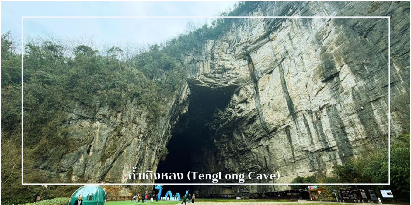
ถ้ำลิงหลวง (TengLong Cave)