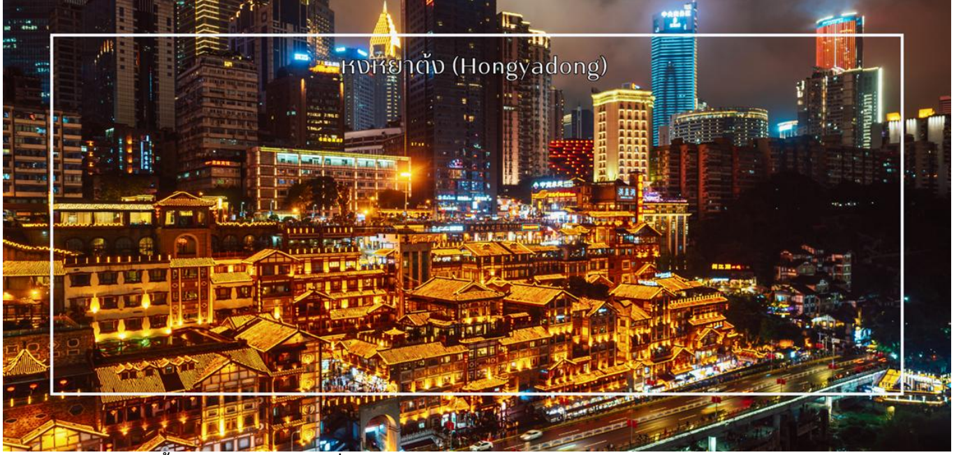
หงยาตั้ง (Hongyadong)

เย็น บริการอาหารเย็น ณ ภัตตาคาร (มื้อที่ 9) เมนูพิเศษ : สุกี้หม่าล่า สมควรแก่เวลา นำท่านเดินทางสู่ ตลาดหงยาตั้ง (Hongyadong) หรือที่เรียกว่า "Hongya Cave" เป็นสถานที่ท่องเที่ยวที่มีชื่อเสียงในเมืองฉงชิ่ง โดยตั้งอยู่ริมแม่น้ำแยงซี มีบรรยากาศที่เต็มไปด้วยวัฒนธรรมและประวัติศาสตร์ ตลาดหงยาตั้งเป็นพื้นที่ที่มีอาคารแบบดั้งเดิมที่สร้างขึ้นในสไตล์สถาปัตยกรรมแบบชิโน-ทิเบต โดยมีร้านค้า ร้านอาหาร และบาร์จำนวนมาก ที่ท่านสามารถลิ้มลองอาหารรสเด็ดและชมพื้นเมืองอื่นๆที่ขึ้นชื่อ ตลาดหงยาตั้งยังมีวิวทิวทัศน์ที่สวยงาม สามารถเดินเล่นตามทางเดินที่มีการจัดแสดงงานศิลปะและสินค้าท้องถิ่น