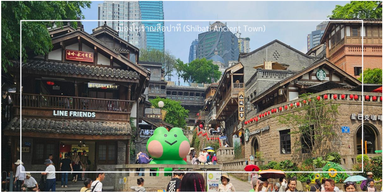
เมืองโบราณคือปาตี (Shibati Ancient Town)

จากนั้นนำทุกท่าน ชมเสน่ห์ย่านเก่าแก่ ถนนโบราณเซี่ยฮ่าว (Xiahao Old Street) ย่านเมืองเก่าใจกลางมหานครฉงชิ่งที่เต็มไปด้วยกลิ่นอายของอดีตผสมกับวิถีชีวิตปัจจุบันอย่างลงตัว ที่นี่เคยเป็นย่านการค้าสำคัญในอดีต ปัจจุบันได้รับการอนุรักษ์และปรับปรุงให้กลายเป็นสถานที่ท่องเที่ยวเชิงวัฒนธรรมที่มีชีวิตชีวา สองฝั่งถนนเรียงรายไปด้วยอาคารเก่าแก่สไตล์จีนโบราณ สลับกับคาเฟ่ มีร้านขายของพื้นเมือง ร้านหนังสือ และมุมถ่ายภาพ ที่ตกแต่งอย่างมีเอกลักษณ์ ท่ามกลางบรรยากาศอบอุ่นของชุมชนเก่าแก่ริมแม่น้ำแยงซี