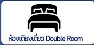
ห้องเตียงเดี่ยว Double Room