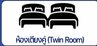
ห้องเตียงคู่ (Twin Room)