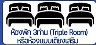
ห้องพัก 3 ท่าน (Triple Room) หรือห้องแบบเตียงเสริม

กรณีพัก 3 ท่านท่านที่เข้าพักโรงแรม ไม่มีห้อง TRP (3 ท่าน) อาจจำเป็นต้องแยกพัก 2 ห้อง (มีค่าใช้จ่ายพักเดี่ยวเพิ่ม) กรณีห้อง TWIN BED (เตียงเดี่ยว 2 เตียง) ซึ่งโรงแรมไม่มีหรือเต็ม ทางบริษัทขอปรับเป็นห้อง DOUBLE BED แทนโดยมีต้องแจ้งให้ทราบล่วงหน้า หรือ หากต้องการห้องพักแบบ DOUBLE BED (1 เตียงใหญ่) ซึ่งโรงแรมไม่มีหรือเต็ม ทางบริษัทขอปรับเป็นห้อง TWIN BED แทนโดยมีต้องแจ้งให้ทราบล่วงหน้า กรณีห้องพักในเมืองที่ระบุไว้ในโปรแกรมมีเทศกาลวันหยุดยาว มีงานประชุมหรืองานแฟร์ต่างๆ บริษัทขอจัดที่พักในเมืองใกล้เคียงแทน