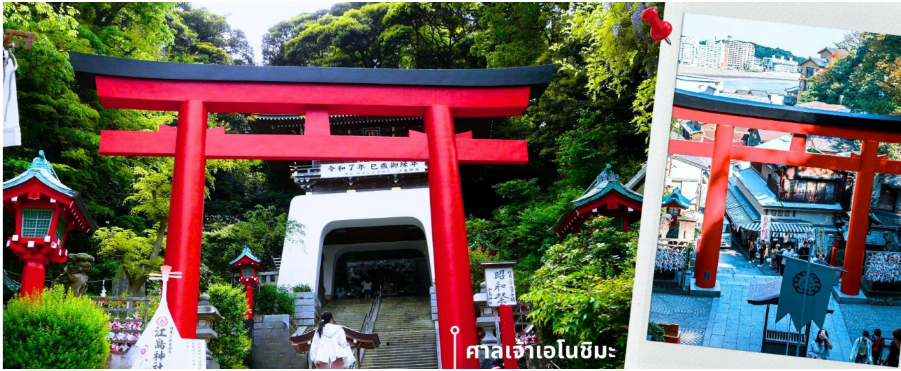
📍 ศาลเจ้าเอโนะชิมะ

จากนั้นนำท่านสักการะ ศาลเจ้าเอโนะชิมะ ศาลเจ้าศักดิ์สิทธิ์ที่ตั้งอยู่บนเนินเขาของเกาะ โดดเด่นด้วยบันไดทางขึ้น ที่ทอดยาวผ่านซุ้มประตูโทริอิและอาคารศาลเจ้าหลายจุดเรียงต่อกัน ภายในประดิษฐานเทพเบนไซเท็น เทพแห่งโชค ลาภ ศิลปะ และความสำเร็จ บรรยากาศโดยรอบเงียบสงบ รายล้อมด้วยธรรมชาติ เหมาะสำหรับการขอพรและ สัมผัสวัฒนธรรมญี่ปุ่นแบบดั้งเดิม จากนั้นให้ท่านได้อิสระเดินเล่นบริเวณ ถนนเบนเซนเท็น นากามิเสะ ซึ่งเป็นถนน