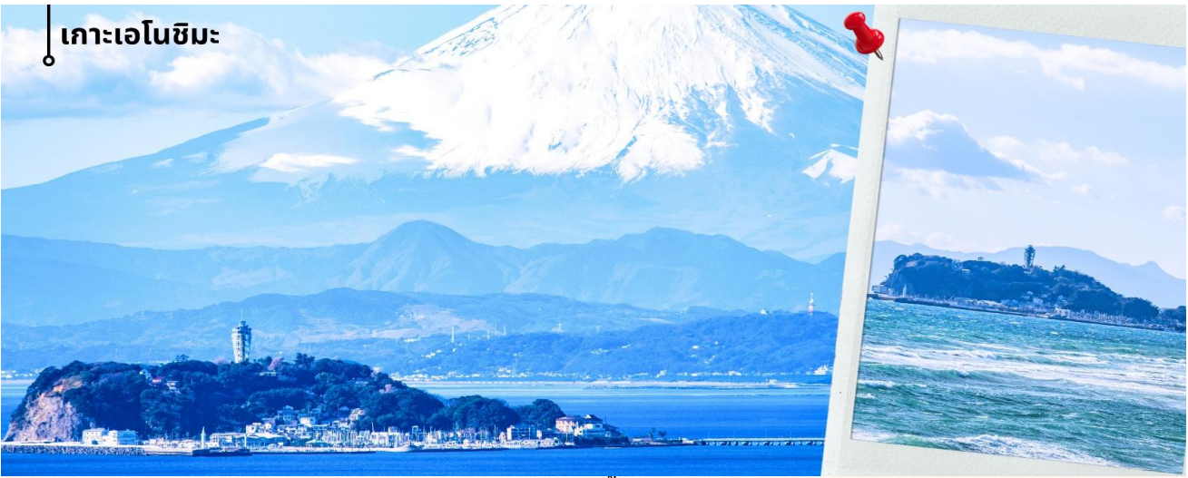
📍 เกาะเอโนะชิมะ

ท่านเดินทางสู่ เกาะเอโนะชิมะ (ใช้เวลาเดินทางประมาณ 1 ชั่วโมง 30 นาที) ผ่านสะพานเอโนะชิมะ เบนเท็น ซึ่งเป็น เส้นทางเชื่อมระหว่างแผ่นดินใหญ่กับตัวเกาะ ระหว่างทางสามารถชมบรรยากาศของท้องทะเลและวิวชายฝั่งได้อย่าง เพลิดเพลิน และในวันที่อากาศแจ่มใยังสามารถมองเห็นภูเขาไฟฟูจิได้จากระยะไกลอีกด้วย