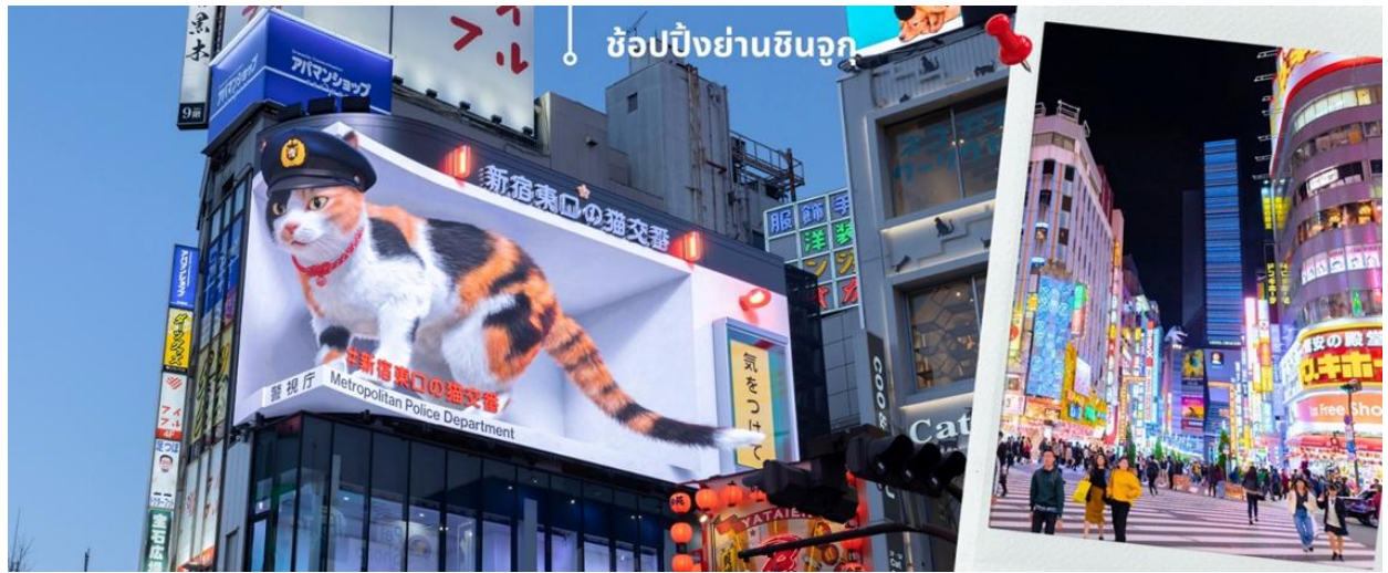
ช้อปปิงย่านชินจูกุ

จากนั้นนำท่านเดินทางสู่ย่าน ช้อปปิงชินจูกุ (Shinjuku) แหล่งช้อปปิ้งชื่อดังในโตเกียวให้ท่านอิสระและเพลิดเพลินกับการช้อปปิ้งสินค้ามากมายทั้งเครื่องใช้ไฟฟ้ากล้องถ่ายรูปดีจิตอลนาฬิกา เครื่องเล่นเกมส์ หรือสินค้าที่ใจคุณผู้หญิงด้วยกระเป๋า รองเท้า เสื้อผ้าแบรนด์เนม เสื้อผ้าแฟชั่นสำหรับวัยรุ่น เครื่องสำอางยี่ห้อดังของญี่ปุ่นไม่ว่าจะเป็น KOSE, KANEBO, SK II, SHISEDO และอื่นๆอีกมากมาย