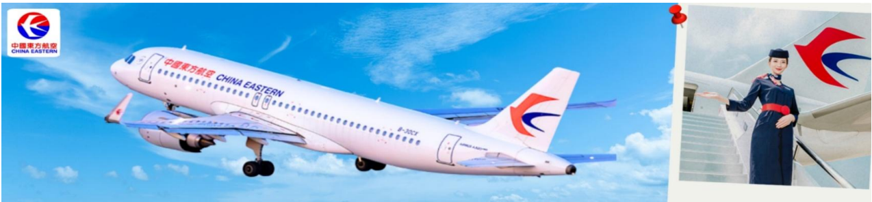
CMUPVG16 เซี่ยงไฮ้-ดิสนีย์แลนด์-อู๋ซี 5 วัน 3 คืน บิน MU China Eastern (Sep-Dec 26) ไม่ลงร้าน

22.30 น. พร้อมกันที่ ท่าอากาศยานสุวรรณภูมิ ณ อาคารผู้โดยสารขาออกชั้น 4 เคาน์เตอร์ สายการบิน China Eastern (MU) โดยมีเจ้าหน้าที่จากทางบริษัทฯ คอยต้อนรับ และอำนวยความสะดวก