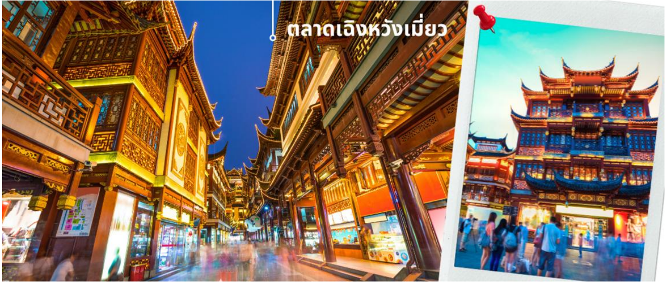
ตลาดเจิ้งหวังเมี่ยว

📌 อิสระอาหารค่ำตามอัธยาศัย เพื่อสะดวกแก่ท่านในการเดินช้อปปิ้งและถ่ายรูป ได้อย่างเต็มที่ ได้เวลาอันสมควร นำคณะเดินทางสู่สนามบิน เชียงไฮ้ผู้ตง