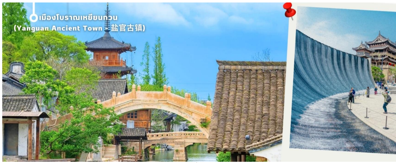
เมืองโบราณเหยียนกวน (Yanguan Ancient Town - 盐官古镇)

แฉะชมผลิตภัณฑ์จากหยก งานฝีมืออันสวยงาม ขึ้นชื่อของจีนถือว่าถ้าใครมาจีนต้องแฉะชมผลงานที่ผลิตจากหยก นำเก็บสะสมเป็นอย่างมาก จากนั้นนำท่านเดินทางกลับเมือง เซี่ยงไฮ้ (ใช้เวลาเดินทางประมาณ 2 ชั่วโมง) นำท่านช้อปปิ้งย่าน ถนนนานจิง Nanjinglu Street ศูนย์กลางสำหรับการช้อปปิ้งที่คึกคักมากที่สุดของนครเซี่ยงไฮ้ รวมทั้งห้างสรรพสินค้าใหญ่ชื่อดังกว่า 10 แห่ง และช้อปปิ้ง ร้าน POP MART สุดฮิตในขณะนี้เพื่อเป็นของฝากที่ระลึก นำท่านสู่บริเวณ หาดว้ายทาน ตั้งอยู่บนฝั่งตะวันตกของแม่น้ำหวงผู้มีความยาวจากเหนือจรดใต้ถึง 4 กิโลเมตร เป็นเขตสถาปัตยกรรมที่ได้ชื่อว่า “พิพิธภัณฑ์สิ่งก่อสร้างหมื่นปีแห่งชาติจีน” ถือเป็นสัญลักษณ์ที่โดดเด่นของมหานครเซี่ยงไฮ้