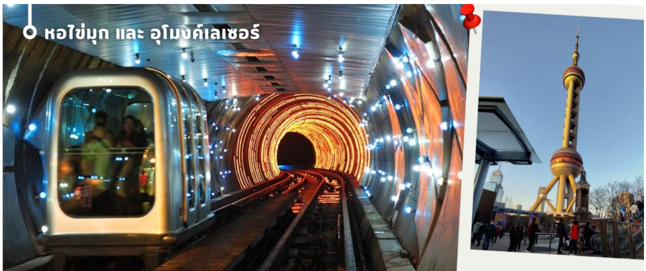
📍 หอไข่มุก และ อุโมงค์เลเซอร์

จากนั้นนำท่านเดินทางมาถ่ายรูปคู่หอไข่มุก และชมความอลังการของ Disney Store Shanghai สาขาที่ใหญ่ที่สุดในโลก