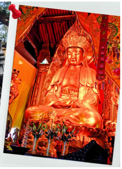
วัดผู้จี Puji Temples