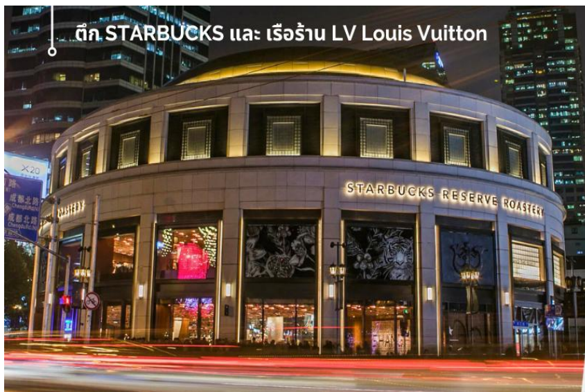
ตึก STARBUCKS และ เรือร้าน LV Louis Vuitton

นำท่านเยี่ยมชม Starbucks Reserve Roastery ร้านกาแฟสตาร์บัคส์ ที่เพิ่มกลิ่นอายอันน่าหลงใหลในเรื่องของกาแฟให้มากขึ้น เช่น เมล็ดกาแฟที่มีให้เลือกมากมายจากหลายประเทศ การนำกรรมวิธีการผลิต มีโรงคั่ว ครูว์ทำเบเกอรี่ และ บาร์ทำกาแฟ เพื่อเพิ่มประสบการณ์ให้กับคอกาแฟได้อย่างน่าสนใจ โดย Starbucks Reserve Roastery รวมทั้งของที่ระลึกจากสตาร์บัคส์ ทำให้คนรักกาแฟ หรือคอสตาร์บัคส์ต้องชอบอย่างแน่นอนอนปัจจุบันมี 6 สาขา ประกอบไปด้วย นิวยอร์ก มิลาน ซีแอตเทิล ฟุกุโอกะ ชิคาโก และเซี่ยงไฮ้ จากนั้นนำท่านแวะ ถ่ายรูปที่แลนด์มาร์คใหม่.. ร้าน LV Louis