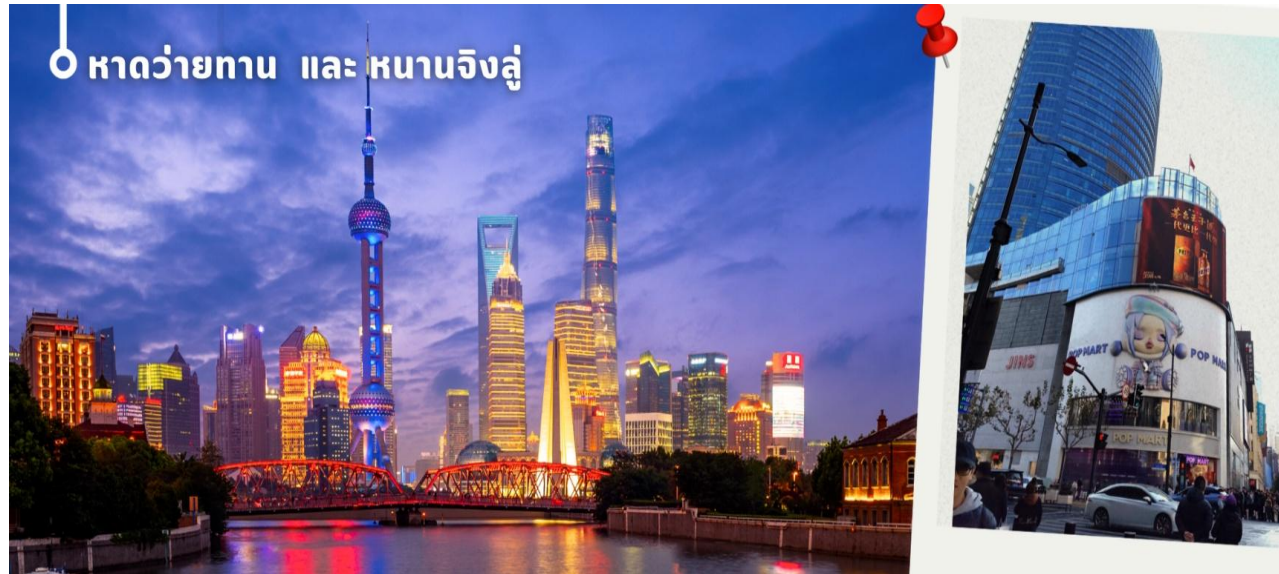
หาดว้ายทาน และ หานานจิงลู่

แฉะชมผลิตภัณฑ์จากหยก งานฝีมืออันสวยงาม ขึ้นชื่อของจีนถือว่าถ้าใครมาจีนต้องแฉะชมผลงานที่ผลิตจากหยก นำเก็บสะสมเป็นอย่างมาก จากนั้นนำท่านเดินทางกลับเมือง เซี่ยงไฮ้ (ใช้เวลาเดินทางประมาณ 2 ชั่วโมง) นำท่านช้อปปิ้งย่าน ถนนนานจิง Nanjinglu Street ศูนย์กลางสำหรับการช้อปปิ้งที่คึกคักมากที่สุดของนครเซี่ยงไฮ้ รวมทั้งห้างสรรพสินค้าใหญ่ชื่อดังกว่า 10 แห่ง และช้อปปิ้ง ร้าน POP MART สุดฮิตในขณะนี้เพื่อเป็นของฝากที่ระลึก นำท่านสู่บริเวณ หาดว้ายทาน ตั้งอยู่บนฝั่งตะวันตกของแม่น้ำหวงผู้มีความยาวจากเหนือจรดใต้ถึง 4 กิโลเมตร เป็นเขตสถาปัตยกรรมที่ได้ชื่อว่า “พิพิธภัณฑ์สิ่งก่อสร้างหมื่นปีแห่งชาติจีน” ถือเป็นสัญลักษณ์ที่โดดเด่นของมหานครเซี่ยงไฮ้