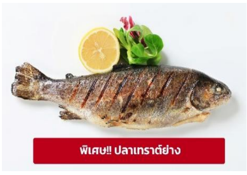
พิเศษ! ปลาเทราต์ย่าง

นำท่านเดินทางสู่ เมืองมรดกโลกเชสกี ครุมลอฟ (Cesky Krumlov) สาธารณรัฐเช็ก (ระยะทาง 210 กม./ 3.30 ชม.) ล้อมรอบด้วยแม่น้ำ Vltava ทำให้เมืองแห่งนี้มีลักษณะคล้ายหยดน้ำ จนถูกขนานนามว่าเป็น "เมืองหยดน้ำ" จากนั้นนำท่านถ่ายรูปบริเวณรอบนอก ปราสาทครุมลอฟ (Cesky Krumlov Castle) เป็นปราสาทกอริคดั้งเดิม ตั้งอยู่ริมฝั่งแม่น้ำวัลตาวาบนแหลมหิน มีหอคอยสี่มุมพวยหวนๆ ราวกับปราสาทเจ้าหญิงในนิยาย มีอายุกว่า 700 ปี เคยเป็นคฤหาสน์ส่วนตัวของขุนนางถึง 3 ตระกูล ก่อนจะตกเป็นสมบัติของรัฐบาล