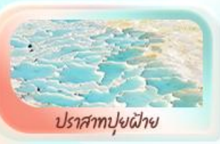
ปราสาทพุยฝ้าย