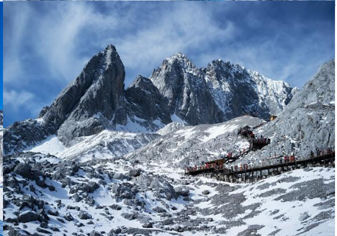
นำท่านเที่ยวชม หุบเขาพระจันทร์สีน้ำเงิน "ไป๋ส่วยเหอ" (รวมรถกอล์ฟ) เป็นหุบเขาที่อยู่ทางตะวันออกของภูเขาหิมะมังกรหยก นำท่านชม ธารน้ำขาว หรือ น้ำตกไป๋ส่วย ธารน้ำที่เป็นเชิงชั้นหินปูนสีขาว หลดหลั่นลามา