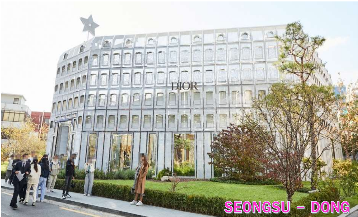
SEONGSU - DONG

กลางวัน รับประทานอาหารกลางวัน ณ ภัตตาคาร เมนูเทศกาลบี เมนูขึ้นชื่อจากเมือง ซุนซอน เป็นอาหารเกาหลีรสเผ็ดหวานที่โดดเด่นด้วยเนื้อไก่หมักซอสโคชูจังเข้มข้น ผสมพริกป่น กระเทียม ซีอิ้ว และเครื่องปรุงรสสูตรพิเศษ หมักจนซึมเข้าเนื้อ ก่อนนำไปผัดบนกระทะร้อนพร้อมกะหล่ำปลี หอมใหญ่ มันหวาน และเส้นต็อกเหนียวนุ่ม ให้รสชาติกลมกล่อม หอมเครื่องเทศ นิยมรับประทานร้อน ๆ คู่กับข้าวสวย หรือเพิ่มซีสียัด ๆ เพื่อเพิ่มความเข้มข้นและความอร่อยยิ่งขึ้น