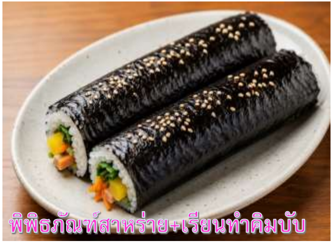
พิพิธภัณฑ์สาหร่าย+เรียนทำคิมบับ

เดินทางสู่ พิพิธภัณฑ์สาหร่าย ที่บอกเล่าเรื่องราว เกี่ยวกับสาหร่าย อาหารชั้นยอดของเกาหลี ที่ กลายเป็นส่วนหนึ่งในวัฒนธรรมการประกอบอาหารของเกาหลี เรียนการทำคิมบับ เป็นกิจกรรม วัฒนธรรมเกาหลีที่เปิดโอกาสให้ได้เรียนรู้การทำอาหารประจำชาติ ร่วมกิจกรรมใส่ชุดฮันบกหลากหลาย ที่มีไว้ให้เลือก พร้อมถ่ายรูปกับฉากและพร็อพที่เตรียมไว้เก็บเป็นที่ระลึกว่าครั้งหนึ่งเราได้เคยมาเยือน ดินแดนที่มีวัฒนธรรมหลากหลายเช่นนี้