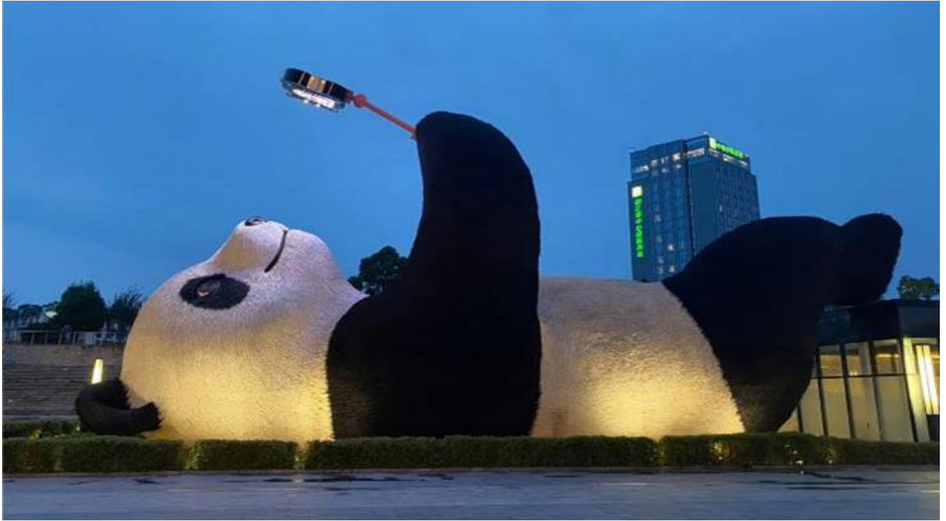
ที่พัก Lavende Hotel หรือระดับเทียบเท่า 4 ดาว (มาตรฐานจีน)

วันที่ 4 อุทยานสัตว์รณี เส้นทางหุบเขาซวงเฉียวโกว(รวมรถอุทยาน) – เมืองตูเจียงเยียน – สะพานโบราณหนานเฉียว – เมืองโบราณกวนเซี่ยน