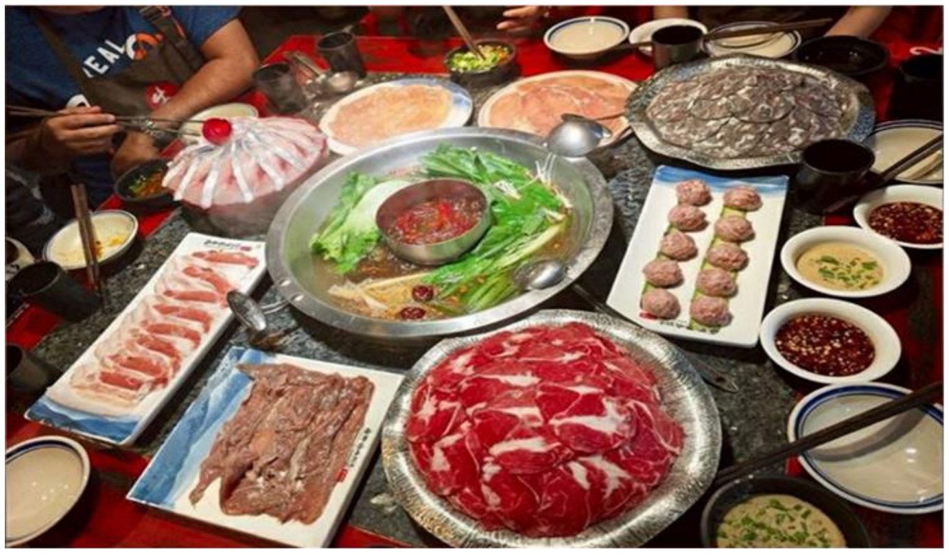
คำ รับประทานอาหารคำ ณ ภัตตาคาร (เมื่อที่ 12) *เมนูพิเศษสุกี้หม่าล่าเสฉวน

อิสระช้อปปิ้ง ถนนไท่กุ๋หลี่ หนึ่งในแหล่งช้อปปิ้งและไลฟ์สไตล์ระดับพรีเมียม ตั้งอยู่ใจกลางเมืองเฉิงตู โดดเด่นด้วยการออกแบบสถาปัตยกรรมที่ผสมผสานระหว่างความโมเดิร์นและวัฒนธรรมจีนดั้งเดิม มีห้างแบรนด์แฟชั่นระดับโลกอย่าง Gucci, Chanel, Balenciaga รวมถึงร้านค้าไลฟ์สไตล์และแฟชั่นท้องถิ่น อาหารท้องถิ่นและคาเฟ่นานาชาติสวยๆ ที่เหมาะสำหรับการนั่งพักผ่อน