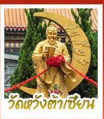
วัดเซว้งต้าเซี่ยน