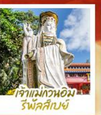
เจ้าแม่กวนอิม รัฟัสสัย