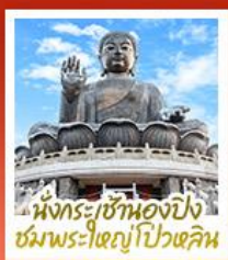
นิงกระชานองปิง ชมพระใหญ่ปิวหลิน