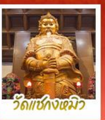
วัดเข่งหนิว