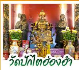
วัดบิกิตต่องฮ่า