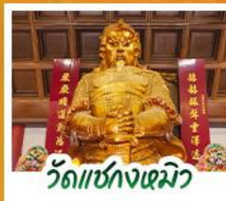
วัดซ่งกวงหิว