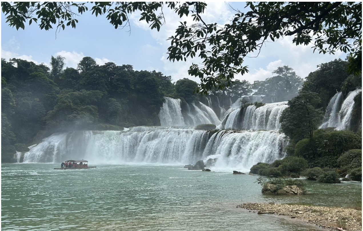
แวะชม ร้านกาแฟน้ำตกเต๋อเทียน ที่มีวิวฉากหลังเป็นน้ำตกขนาดใหญ่และภูเขาเขียว ธรรมชาติสวยงามบรรยากาศผ่อนคลาย เอาใจสายคาเฟ่ให้ท่านได้ ชิม ซ้อป แซ่ะ ไปกับบรรยากาศอย่าง Slow Life ท่ามกลางธรรมชาติ