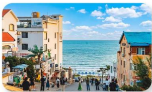
ถนนคนพลิงหมายเลขแปด