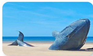
ประติมากรรมวาฬผู้โดดเดี่ยว