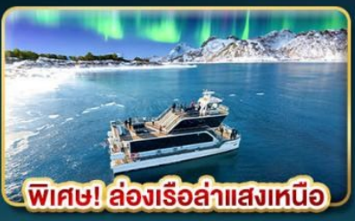
พิเศษ! ล่องเรือลำแสงเหนือ