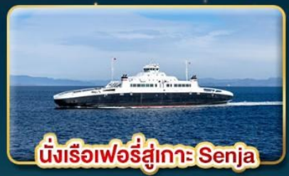
นั่งเรือเฟอร์รี่สู่เกาะ Senja