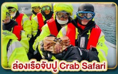
ล่องเรือจับปู Crab Safari

เยือนเมืองหลวงแห่งแสงเหนือ สัมผัสความสวยงามของนอร์เวย์ที่แท้จริง