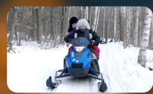
จักรยาน SNOW MOTORCYCLE