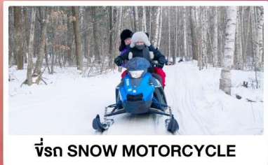
ขี่รถ SNOW MOTORCYCLE