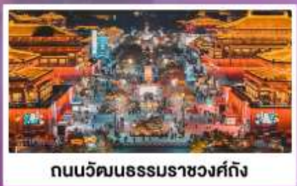
ถนนวัฒนธรรมราชวงศ์ถัง