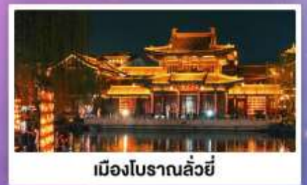
เมืองโบราณลั่วยี