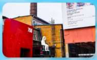
798 Art Zone