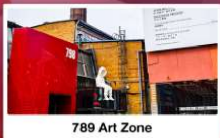
798 Art Zone