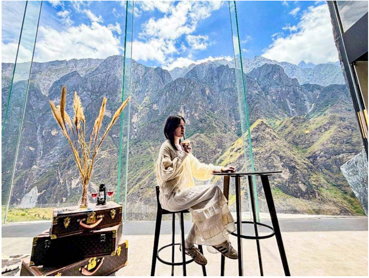
นำท่านชมเมืองโบราณเจดีย์น(เมืองโบราณแข่งกริล่า) บ้านเรือนจะเป็นบ้านไม้ในสไตล์ทิเบต ศูนย์รวมของวัฒนธรรมชาวทิเบต ลักษณะคล้ายชุมชนเมืองโบราณทิเบต ซึ่งเต็มไปด้วยร้านค้าของคนพื้นเมือง ร้านขายสินค้าที่ระลึกมากมาย