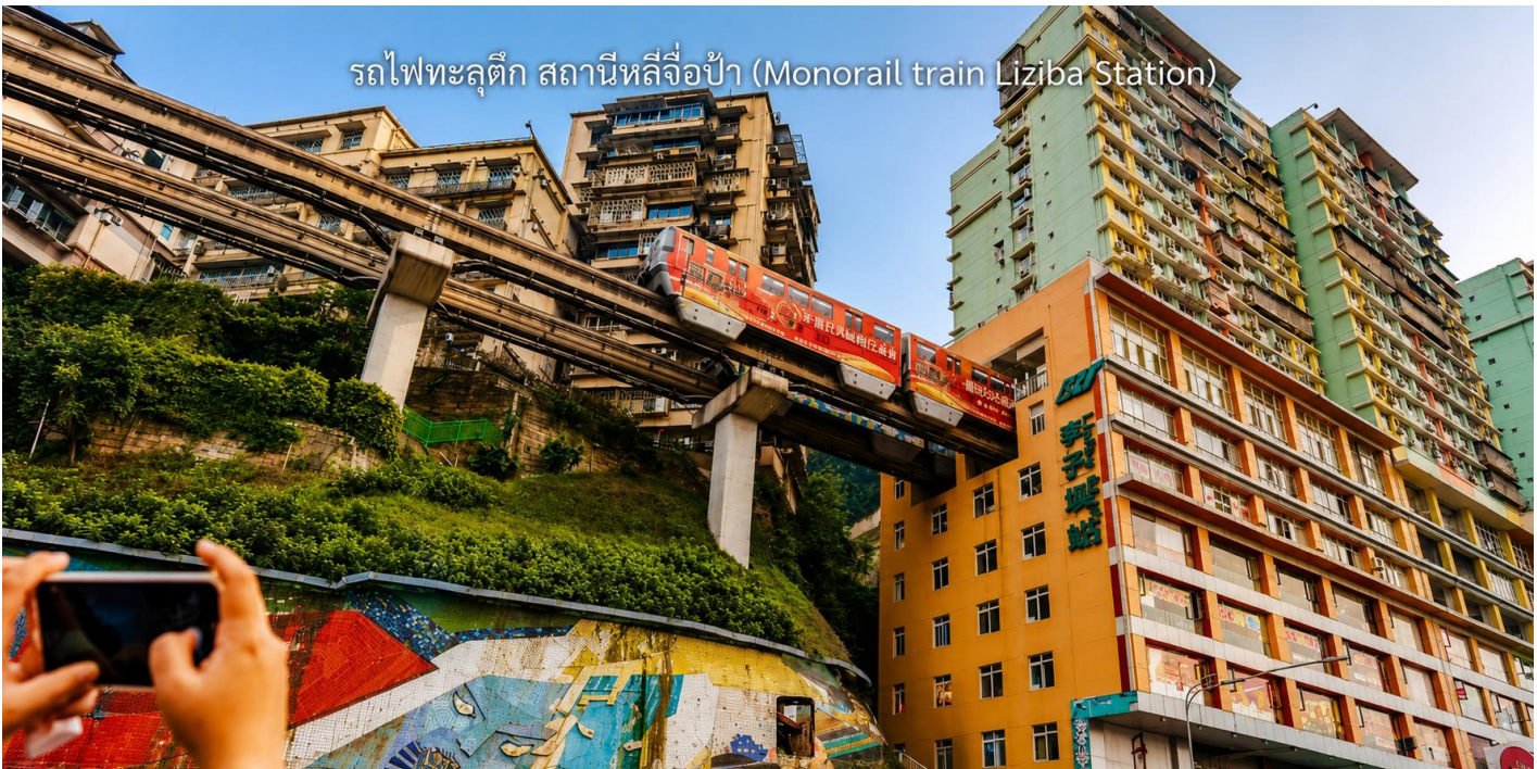
รถไฟทะลุตึก สถานีหลี่จื่อป้า (Monorail train Liziba Station)

จากนั้นนำท่าน นั่งรถไฟทะลุตึก (Monorail Train) หนึ่งในประสบการณ์ที่น่าสนใจและเป็นเอกลักษณ์ในเมืองฉงชิ่ง รถไฟเส้นนี้มีเส้นทางที่ผ่านอาคารและที่อยู่อาศัย ทำให้ผู้โดยสารรู้สึกเหมือนกำลังนั่งรถไฟที่ทะลุผ่านตึกสูง เส้นทางที่ น่าสนใจในรถไฟนี้รวมถึงสถานีที่มีชื่อเสียง เช่น สถานีหลี่จื่อป้า (Liziba Station) ซึ่งตั้งอยู่ในพื้นที่ที่มีความหนาแน่น ของประชากร การนั่งรถไฟทะลุตึกนี้เป็นวิธีที่ยอดเยี่ยมในการสัมผัสกับวัฒนธรรมเมืองฉงชิ่งและชื่นชมกับการพัฒนา เมืองที่น่าทึ่ง หากคุณมีโอกาสไปเยือนฉงชิ่ง อย่าลืมนั่งรถไฟเส้นนี้เพื่อสัมผัสประสบการณ์ที่ไม่เหมือนใคร