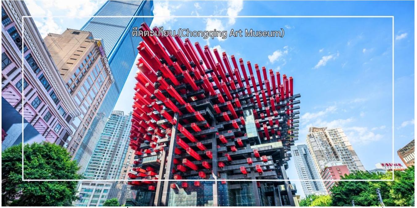
ตึกตะเกียบ (Chongqing Art Museum)

นำท่านสู่ ถนนคนเดินเจี๋ยฟางเป่ย์ (Jiefangbei Pedestrian Street) ย่านการค้าและแลนด์มาร์คสำคัญที่สุดแห่งหนึ่งของเมือง ฉงชิ่ง และได้รับการขนานนามว่าเป็น "ถนนสายแรกแห่งจินตตะวันตก" โดยมีอนุสาวรีย์ปลดปล่อยประชาชน (Jiefangbei Monument) ตั้งอยู่ใจกลางย่านแห่งนี้ ที่นี่คือหนึ่งในแหล่งช้อปปิ้งและท่องเที่ยวที่สำคัญที่สุดในเมืองฉงชิ่ง (Chongqing) เป็นพื้นที่ที่มีชีวิตชีวาและคึกคัก ถนนนี้ตั้งอยู่ใกล้กับสถานที่ท่องเที่ยวสำคัญอื่นๆ เช่น ตึกตะเกียบ ทำให้สามารถเดินเที่ยวชม เดินเล่น ถ่ายภาพ ได้อย่างสะดวก ถนนสายนี้มีบรรยากาศที่มีชีวิตชีวา และยังเต็มไปด้วยร้านค้าสินค้าแบรนด์เนมร้านสินค้าท้องถิ่นและร้านค้าขายสินค้าต่างๆ เช่น เสื้อผ้าเครื่องประดับและของที่ระลึก