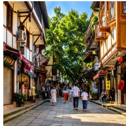
เย็น อีระอาหารเย็น

จากนั้นเดินทางเข้าสู่โรงแรมที่พัก Chongqing Holiday Inn Hotel ระดับ 4 ดาว หรือเทียบเท่า