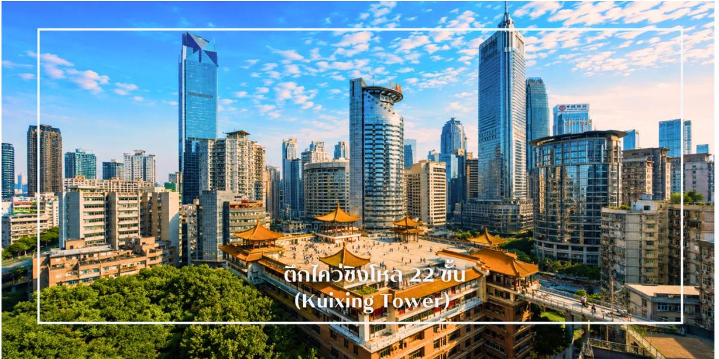
ตึกไควซิงโหล 22 ชั้น (Kuixing Tower)

หลังอาหารเช้านำท่านเที่ยวชม ตึกไควซิงโหล 22 ชั้น (Kuixing Tower) หนึ่งในแลนด์มาร์คสุดแปลกของนครฉงชิ่ง ประเทศจีน ที่โด่งดังจากโครงสร้างอาคารซึ่งมีความสูงไล่ระดับไปตามภูเขา ด้วยลักษณะพิเศษที่ฝั่งหนึ่งของตึกคือชั้น 1 แต่เมื่อเดินข้ามไปอีกฝั่ง กลับกลายเป็นชั้น 22 ได้อย่างน่าทึ่ง! ตึกคู่ชิงสะท้อนถึงสภาพภูมิประเทศแบบเมืองเขาอันเป็นเอกลักษณ์ของฉงชิ่ง และกลายเป็นจุดถ่ายรูปยอดนิยมของนักท่องเที่ยวจากทั่วโลก