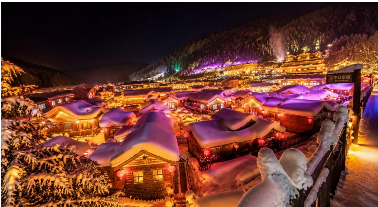
TF-HRBJD01 ฮาร์บิน รวมกิจกรรมจัดเต็ม พักหมู่บ้านหิมะ เทศกาลน้ำแข็งนานาชาติ สวนตุ๊กตาหิมะ 6วัน 4คืน CAPITAL AIRLINES (JD) #ทัวร์ไม่ล้าร้าน Page 8 of 16

หลังอาหารค่ำ อิสระให้ท่านเดินชมบรรยากาศยามค่ำคืนของหมู่บ้านหิมะ ที่แต่งแต้มด้วยแสงไฟจากโคมแดงสไตล์จีน ส่องประกายสว่างไสวทั่วหมู่บ้าน ช่วงเวลาประมาณ 18.30 น. สนุกสนานกับการแสดง รำวงพื้นบ้านจีน บริเวณลานกลางแจ้ง โดยมีชาวบ้านท้องถิ่นร่วมร้องรำและเชิญชวนนักท่องเที่ยวเข้าร่วมเต้นรำคลายหนาว ท่ามกลางเสียงเพลงพื้นเมือง สร้างความประทับใจไม่รู้ลืม หลังจากนั้นนำท่าน ชมแสงสีภายในหมู่บ้านหิมะ Dream Home (รวมค่าเช่า) สัมผัสบรรยากาศราวกับดินแดนแห่งเทพนิยาย เก็บภาพประทับใจกับบ้านไม้ดั้งเดิมที่ถูกหิมะปกคลุมจนหลังคาโค้งมนคล้ายดอกเห็ดขาว ท่ามกลางแสงไฟหลากสีที่ตกแต่งอย่างอบอุ่นและโรแมนติกมีเสน่ห์เฉพาะตัว สร้างความงดงามตราตรึงใจในยามค่ำคืน