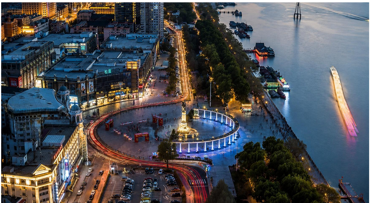
ให้ท่านอิสระช้อปปิ้ง ถนนคนเดินจงหยาง (Zhongyuan Pedestrian Street) ถนนคนเดินชื่อดังของฮาร์บิน แหล่งรวมสินค้าท้องถิ่น ร้านค้า คาเฟ่ ร้านอาหาร เสื้อผ้า แฟชั่น รองเท้าและของฝากหลากหลายสไตล์ บรรยากาศยุโรปและจีนที่ผสมผสานได้อย่างลงตัว แวะชม Popmart เก็บคอลเลคชั่นใหม่ ๆ ของพี กเกอร์สุดน่ารัก ที่สายสะสมของเล่นไม่ควรพลาด