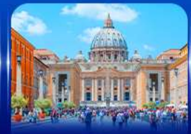
นครรัฐวาติกัน โรม