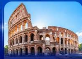
เช็ควินด์ง โคลอสเซียม โรม