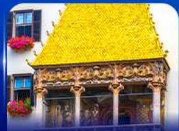
หลังคาทองคำ อินส์บรุค