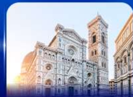
ชมเมืองแห่งศิลปะ ฟลอเรนซ์