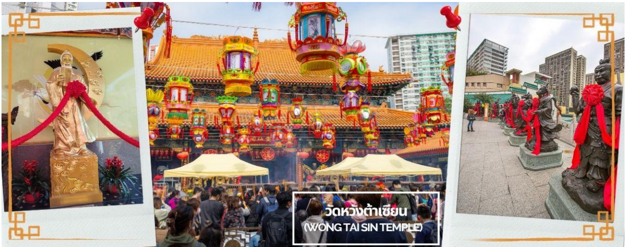
CCX20 ฮ่องกง ไหว้พระ ดิสनीแลนด์ 3วัน 2คืน บิน CX Cathay Pacific (Nov 26-Mar 70)

จากนั้นนำท่านเดินทางสู่ วัดหวังต้าเซียน (WONG TAI SIN TEMPLE) เป็นวัดเก่าแก่อายุกว่าร้อยปี (คนจีนวางตั่ง จะเรียกวัดนี้ว่า ห่วงไท่ซิน) ซึ่งวัดแห่งนี้เป็นที่ประดิษฐานของเทพเจ้าเงินหลายองค์ เทพเจ้าหลักของวัดคือเทพหวังต้าเซียน ท่านเทพเจ้าหวังต้าเซียน ชื่อเดิมคือ "ห้วงซ้อเผ่ง" เป็นมนุษย์ธรรมดา เป็นเด็กเลี้ยงแพะที่มีความกตัญญูต่อบิดามารดา เมื่อถึงวันหนึ่งได้มีโอกาสพบกับนักพรต และได้รับการชักชวนให้ไปเล่าเรียนวิชา ท่านห้วงซ้อเผ่ง ตัดสินใจตามนักพรต ออกไปศึกษาเล่าเรียนวิชา จนบรรลุ สามารถเสกก้อนหินให้กลายเป็นแพะได้ หลังจากนั้นก็ได้ลาอาจารย์นักพรต กลับมาใช้วิชาความรู้ที่ร่ำเรียนมาด้านสมุนไพร ใช้อรักษาคนที่เจ็บไข้ได้ป่วย ท่านได้ใช้วิชาการแพทย์สมุนไพร บำเพ็ญประโยชน์กับชาวบ้านมาตลอดช่วงชีวิต และยังถ่ายทอดวิชาให้กับลูกศิษย์มากมาย จนได้รับยกย่องว่าเป็นเทพห้วงไท่ซิน และได้ตั้งศาลห้วงไท่ซิน เอาไว้ เพื่อกราบสักการะ นอกจากนั้นแล้ว ภายในวัดยังมี เทพเจ้าด้ายแดง หรือเทพเจ้าหยุกไหลว รูปปั้นสีทอง มีเสี้ยวพระจันทร์อยู่ด้านหลัง เป้าหมายของคนโสดอยากมีคู่!!! โดยการขอพรกับเทพเจ้าองค์นี้ต้องใช้ด้ายแดงผูกนิ้วเอาไว้ไม่ให้หลุดระหว่างพิธี เพราะชาวจีนเชื่อว่าด้ายแดงนี้แหละคือ เส้นโยงโชคชะตาด้านความรัก คนโสดก็เป็นการขอพรให้เจอเนื้อคู่ ส่วนคนมีคู่ ก็จะช่วยทำให้มีความรักที่มั่นคงและยืนยาว เมื่อไปถึงจะเห็นรูปปั้นของเทพหยุกไหลวอยู่ตรงกลาง เมื่อหันหน้าเข้าหาเทพหยุกไหลว จะพบรูปปั้นเจ้าบ่าว อยู่ทางขวา และรูปปั้นเจ้าสาวอยู่ทางซ้าย โดยมีด้ายแดงผูกโยงจากเจ้าบ่าวและเจ้าสาวมาที่เทพหยุกไหลว ซึ่งท่านจะคอยทำหน้าที่จัดรายชื่อคู่รัก เชื่อกันว่าสมุดที่ผู้เฒ่าถือในมือ คือบัญชี