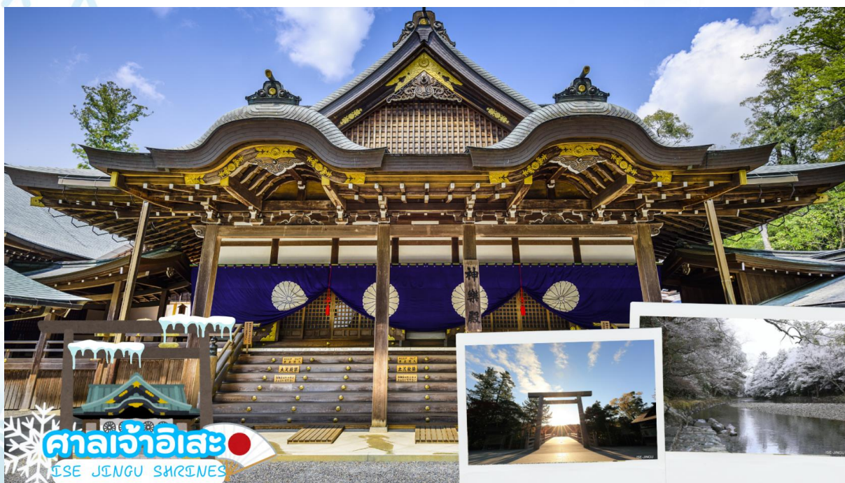
ศาลเจ้าอิเซ ISE JINGU SHRINES

นำท่านเดินทางสู่ ศาลเจ้าอิเซ (Ise Jingu Shrines) เป็นศาลเจ้าชินโตที่มีชื่อเรื่องความศักดิ์สิทธิ์และเก่าแก่ มีอายุกว่า 2,000 ปี ตัวศาลเจ้าถูกสร้างและออกแบบสถาปัตยกรรมโบราณที่สุด ประกอบด้วยส่วนนอกและส่วนใน มีสะพานยูจิบาชิ ข้ามแม่น้ำอิซุซุ เชื่อม 2 ส่วน เมื่อข้ามสุดสะพานมีประตูโทริอิเข้าสู่แดนศักดิ์สิทธิ์ส่วนใน ก่อนเข้าแต่ละส่วนจะมีที่ล้างมือและปากอยู่ด้านหน้า เพื่อความบริสุทธิ์ของผู้มาเยือน ตั้งแต่ครั้งโบราณมีผู้ศรัทธาเชื่อกันว่าที่นี่เป็นที่สถิตย์ของเทพเจ้า Amaterasu หรือเทพเจ้าสุริยเทพ จึงมีผู้ศรัทธาทั่วญี่ปุ่นเดินทางไปกราบไหว้มิได้ขาดสายกระทั่งถึงปัจจุบัน นอกจากนี้ศาลเจ้าอิเซยังเป็นที่เก็บรักษากระจกศักดิ์สิทธิ์หนึ่งในสามสิ่งศักดิ์สิทธิ์สำหรับใช้ในพระราชพิธีราชาภิเษกจักรพรรดิญี่ปุ่น