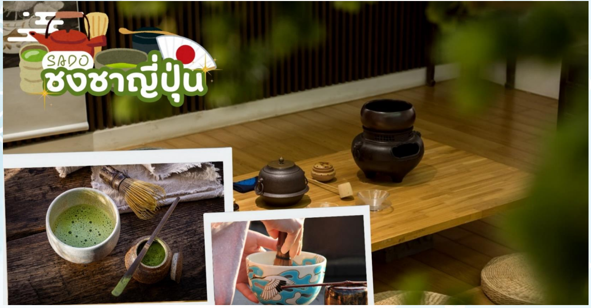
GO2KIX-TG090 -- ปล่อยใจในลมหนาว โอซาก้า นารา เกียวโต มิเอะ เมืองเก่าเสน่ห์ใหม่ 6วัน 4 คืน โดยสายการบินไทย [TG]

กลางวัน รับประทานอาหารกลางวัน ณ ร้านอาหาร (มื้อที่ 7)