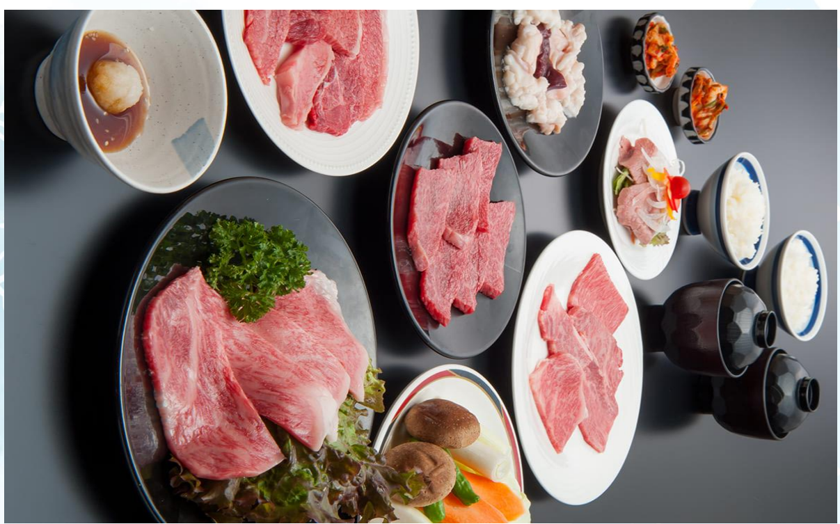
GO2KIX-TG090 -- ปล่อยใจในลมหนาว โอซาก้า นารา เกียวโต มิเอะ เมืองเก่าเสน่ห์ใหม่ 6วัน 4 คืน โดยสายการบินไทย [TG]

นำท่านเดินทางเข้าสู่ เมืองมัตสึซากะ (Matsusaka) เมืองนี้ถือเป็นบ้านเกิดของเนื้อมัตสึซากะที่มีชื่อเสียงระดับโลก เนื้อมัตสึซากะได้รับการยกย่องว่าเป็นหนึ่งในเนื้อวัวที่ดีที่สุดในโลกด้วยความนุ่มละมุนและรสชาติที่เข้มข้น มีชาเซ็นฉะอันมีเอกลักษณ์ มีผ้าฝ้ายที่ประวัตินานกว่า 400 ปี เหมาะสำหรับนักท่องเที่ยวที่อยากชื่นชมสถาปัตยกรรมเก่าๆ หัตถกรรม อาหาร และเทศกาลต่างๆ