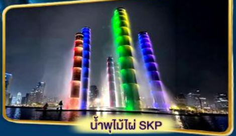
น้ำพุไม้ไผ่ SKP