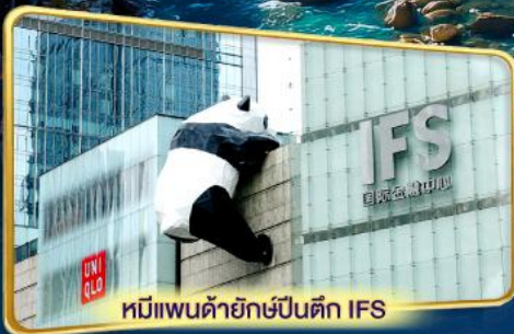
หมีแพนด้ายักษ์ป็นตึก IFS