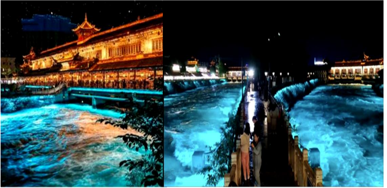
ที่พัก MING ZHI SHANGCHUN HOTEL หรือระดับเทียบเท่า 4 ดาว(มาตรฐานจีน)

นำท่านเที่ยวชม สะพานโบราณหนานเจียว เป็นสถานที่ท่องเที่ยวขนาดใหญ่ที่มีธีมเป็นน้ำ ในโครงการอนุรักษ์น้ำตู่เจียงเอี้ยน ซึ่งเป็นมรดกทางวัฒนธรรมของโลก โดยผสมผสานเทคโนโลยีสมัยใหม่เข้ากับวัฒนธรรมการอนุรักษ์น้ำโบราณครอบคลุมพื้นที่กว่า 1,000 เอเคอร์ หากได้ไปในเวลากลางคืนท่านจะได้ชมวิวแห่งนี้คือการแสดง แสงและเงา "น้ำตาสีฟ้า" น้ำตาสีน้ำเงินเป็นจุดลึกลับเรื่องแสงที่มีลักษณะเฉพาะ ซึ่งจะเปล่งแสงสีฟ้าเมื่อถูกกระตุ้นส่งผลให้ทะเลสาบปล่อยแสงสีฟ้ากลับในเวลากลางคืน นักท่องเที่ยวที่มาเยือนทะเลสาบชิงเฉิงทางเรือจะรู้สึกราวกับอยู่ในแดนสวรรค์ และสัมผัสได้ถึงความอ่อนโยนและความเงียบสงบของผืนน้ำ