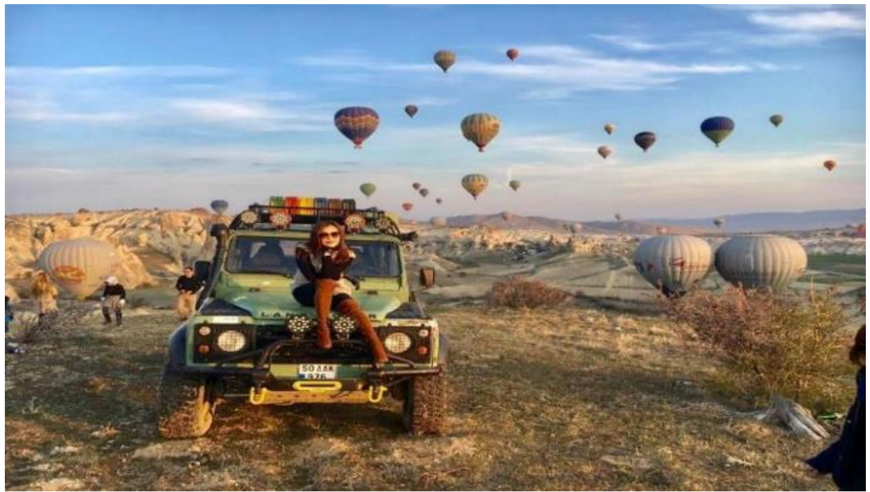
3. Classic Car นั่งรถคลาสสิก เปิดประทุน สูดอากาศ เย็น สดชื่น พร้อมชมบอลลูนสีสดใส วิวเมือง คัปปาโดเกีย ค่าใช้จ่าย 120 USD / ท่าน