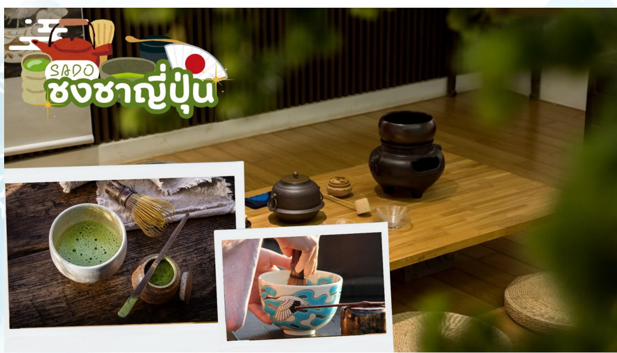
SADO ชงชาญี่ปุ่น

ศาลเจ้าเฮอัน (Heian Shrine) สร้างขึ้นเพื่อเป็นอนุสรณ์ฉลองอำนาจปกครองของเมืองเกียวโตที่ครบรอบ 1,100 ปีในฐานะเมืองหลวงของประเทศญี่ปุ่น โดยมีประตูโทริอิสีแดงตระหง่านเป็นองค์ประกอบที่สะดุดตาที่สุด ศาลเจ้าแห่งนี้เป็นสัญลักษณ์อันโดดเด่นและสถานที่ท่องเที่ยวสำคัญของเกียวโต บริเวณด้านหลังของศาลเจ้านี้ มีสวนเฮอัน ครอบคลุมพื้นที่ประมาณ 33,000 ตารางเมตร สามารถเดินเล่นสัมผัสความร่มรื่นได้อย่างสงบผ่อนคลาย บรรยากาศธรรมชาติของที่นี่เรียกได้ว่าสวยงามทุกฤดูกาล