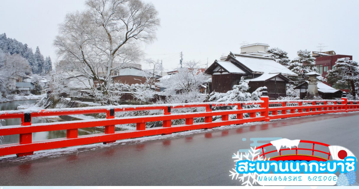
สะพานนาคะบาชิ (Nakabashi Bridge) สะพานสีแดงของย่านเมืองเก่า สะพานทอดข้ามแม่น้ำมิกากาวะที่ไหลผ่านใจกลางเมือง สะพานแห่งนี้ถือเป็นสัญลักษณ์ของเมืองทาคายามา

นำท่านเดินทางสู่ เมืองทาคายามา (TAKAYAMA) เป็นเมืองเล็ก ๆ ที่ตั้งอยู่จังหวัดกิฟุ ตัวเมืองมีสถานที่ท่องเที่ยวสำคัญ ๆ มีศิลปวัฒนธรรมและสถานปัตยกรรมแบบดั้งเดิมและมีธรรมชาติที่สวยงาม ทำให้ทาคายามาเป็นเมืองสวยอันดับต้น ๆ ของญี่ปุ่น