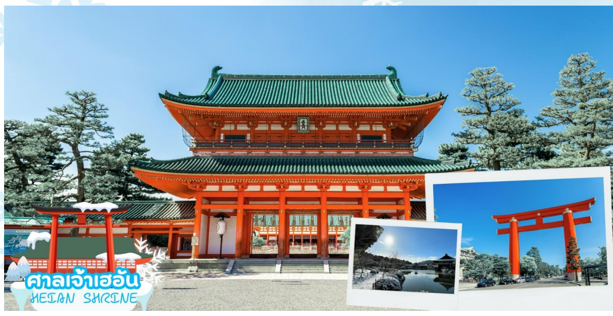
ศาลเจ้าเฮอัน HEIAN SHRINE

ศาลเจ้าเฮอัน (Heian Shrine) สร้างขึ้นเพื่อเป็นอนุสรณ์ฉลองอำนาจปกครองของเมืองเกียวโตที่ครบรอบ 1,100 ปีในฐานะเมืองหลวงของประเทศญี่ปุ่น โดยมีประตูโทริอิสีแดงตระหง่านเป็นองค์ประกอบที่สะดุดตาที่สุด ศาลเจ้าแห่งนี้เป็นสัญลักษณ์อันโดดเด่นและสถานที่ท่องเที่ยวสำคัญของเกียวโต บริเวณด้านหลังของศาลเจ้านี้ มีสวนเฮอัน ครอบคลุมพื้นที่ประมาณ 33,000 ตารางเมตร สามารถเดินเล่นสัมผัสความร่มรื่นได้อย่างสงบผ่อนคลาย บรรยากาศธรรมชาติของที่นี่เรียกได้ว่าสวยงามทุกฤดูกาล