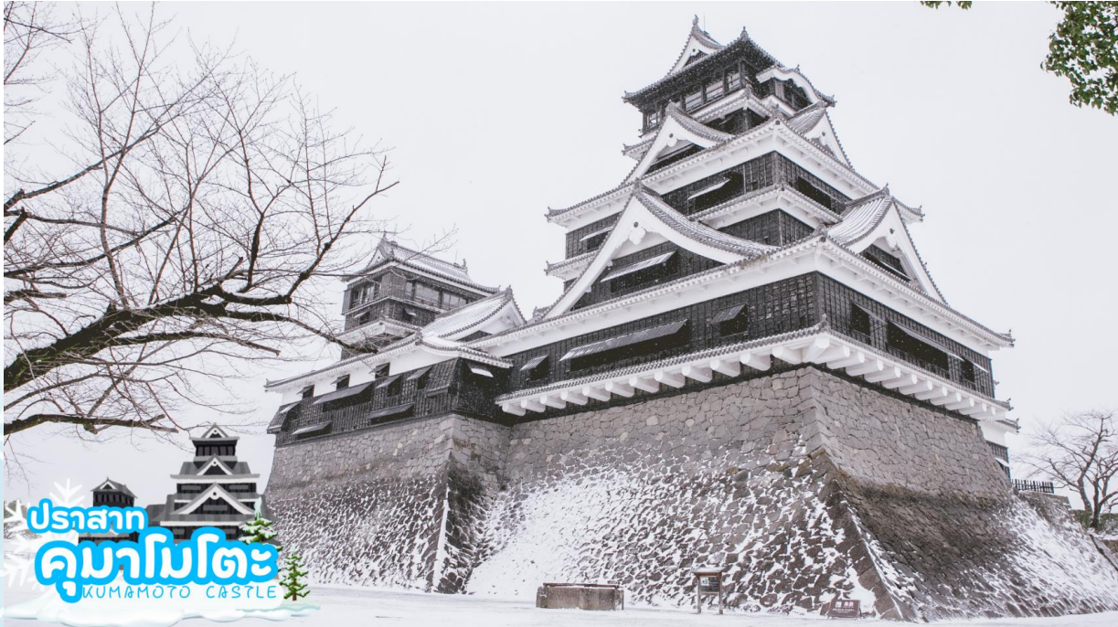
ปราสาท คумаโมโตะ KUMAMOTO CASTLE

กลางวัน รับประทานอาหารกลางวัน ณ ร้านอาหาร (มื้อที่ 6)