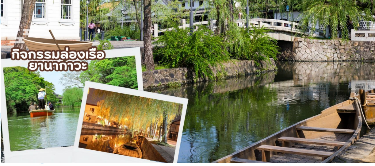
กิจกรรมล่องเรือ ยานากาวะ

กลางวัน รับประทานอาหารกลางวัน ณ ร้านอาหาร (มื้อที่ 6)