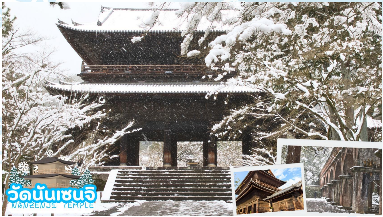
วัดนันเซนจิ NANZENJI TEMPLE

กลางวัน รับประทานอาหารกลางวัน ณ ร้านอาหาร (มื้อที่ 1)