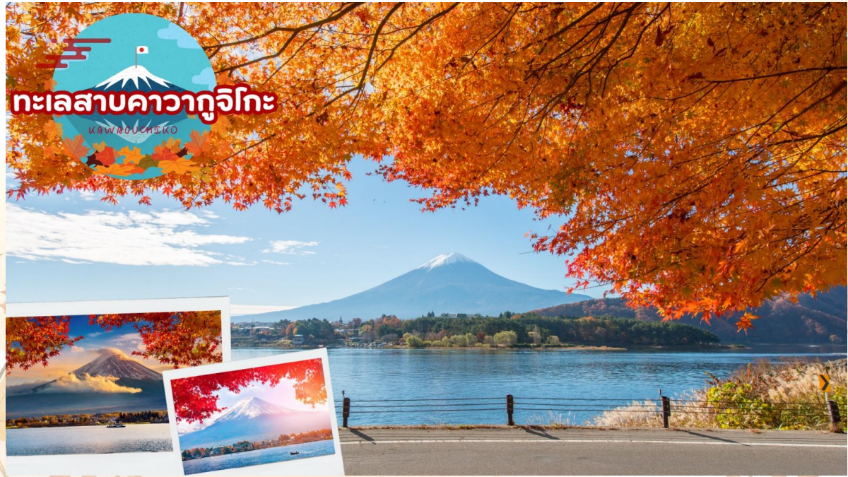
GO2KIX-TG094 -- OSAKA TOKYO KAWAGUCHIKO AUTUMN ชมวิวฟูจิสุดฮิต 6D 3N BY TG

เช้า รับประทานอาหารเช้า ณ ห้องอาหารของโรงแรม (มื้อที่ 6)