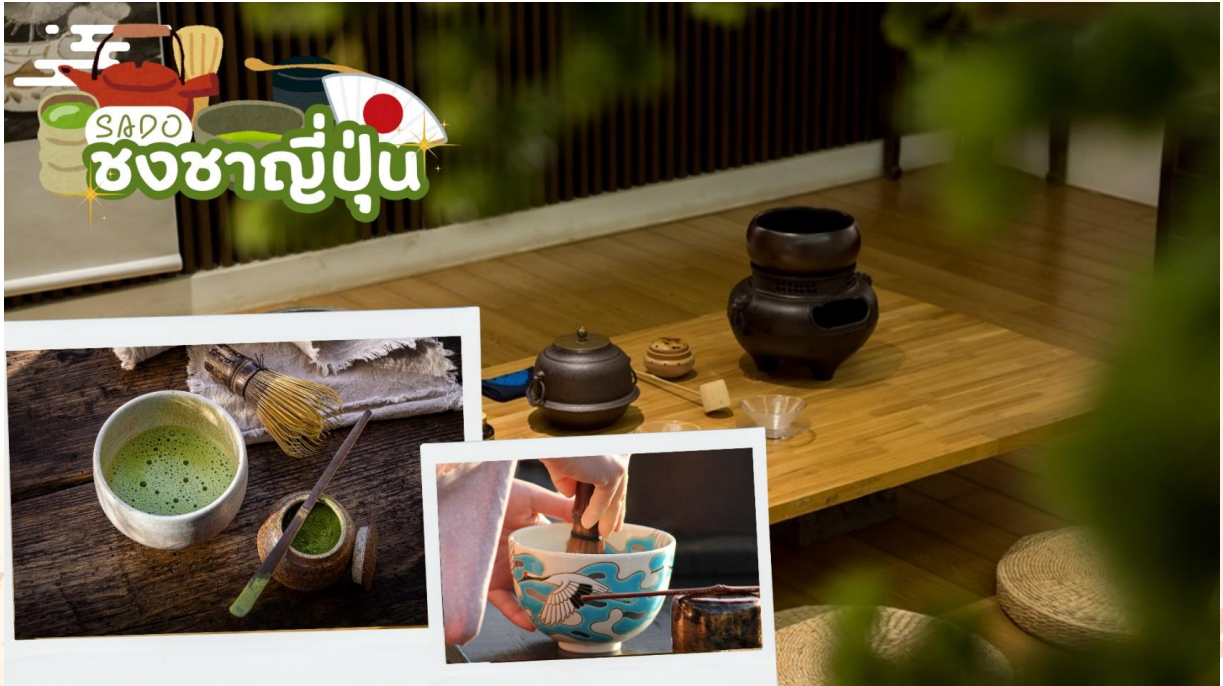
SADO ชงชาญี่ปุ่น

สัมผัสวัฒนธรรมดั้งเดิมของชาวญี่ปุ่น นั่นก็คือ กิจกรรมการชงชาญี่ปุ่น (Sado) โดยการชงชาตามแบบญี่ปุ่นนั้น มีขั้นตอนมากมาย เริ่มตั้งแต่การชงชา การจับถ้วยชา และการดื่มชา ทุกขั้นตอนนั้นล้วนมีขั้นตอนที่มีรายละเอียดที่ประณีตและสวยงามเป็นอย่างมาก และท่านยังมีโอกาสได้ลองชงชาด้วยตัวท่านเองอีกด้วย ซึ่งก่อนกลับให้ท่านอิสระเลือกซื้อของที่ฝากของที่ระลึกตามอัธยาศัย