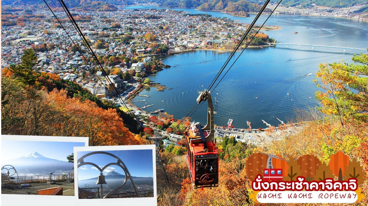
นั่งกระเช้าคาคิ KACHI KACHI ROPEWAY