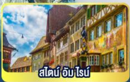
สไตน์ อิม โรย