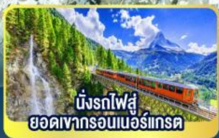
นั่งรถไฟสู่ ยอดเขากรอนเนอร์เกรต