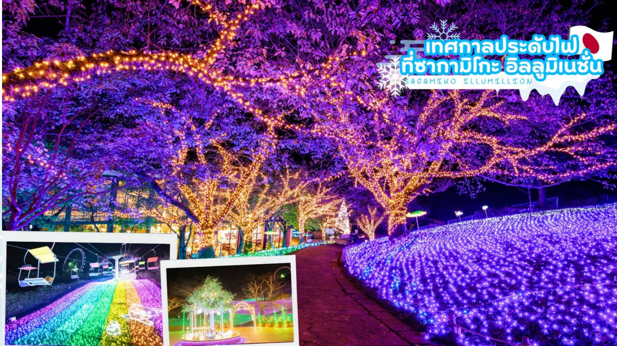
GO2HND-TG058 - TOKYO OSAKA TAKAYAMA ILLUMINATION WINTER 6D 4N BY [TG]