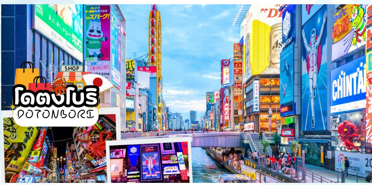
GO2HND-TG058 - TOKYO OSAKA TAKAYAMA ILLUMINATION WINTER 6D 4N BY [TG]

กลางวัน รับประทานอาหารกลางวัน ณ ร้านอาหาร (มื้อที่ 6)