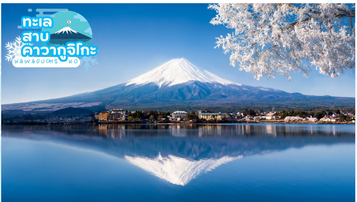
GO2HND-TG058 - TOKYO OSAKA TAKAYAMA ILLUMINATION WINTER 6D 4N BY [TG]

เช้า รับประทานอาหารเช้า ณ ห้องอาหารของโรงแรม (มื้อที่ 3)