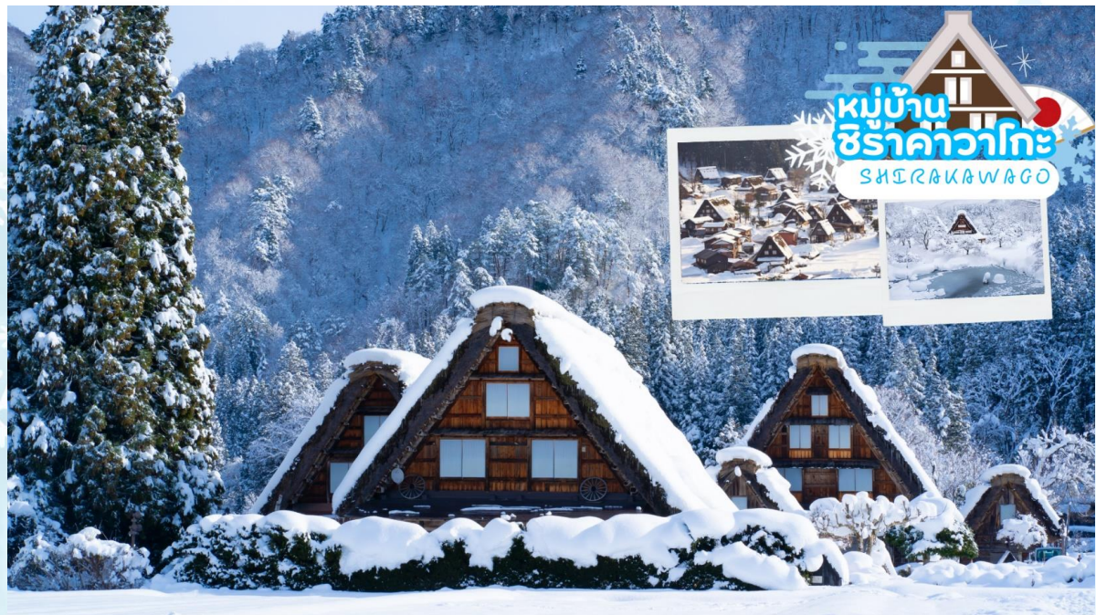
หมู่บ้าน ชิราคาวาโกะ SHIRAKAWAGO

กลางวัน รับประทานอาหารกลางวัน ณ ร้านอาหาร (มื้อที่ 1)