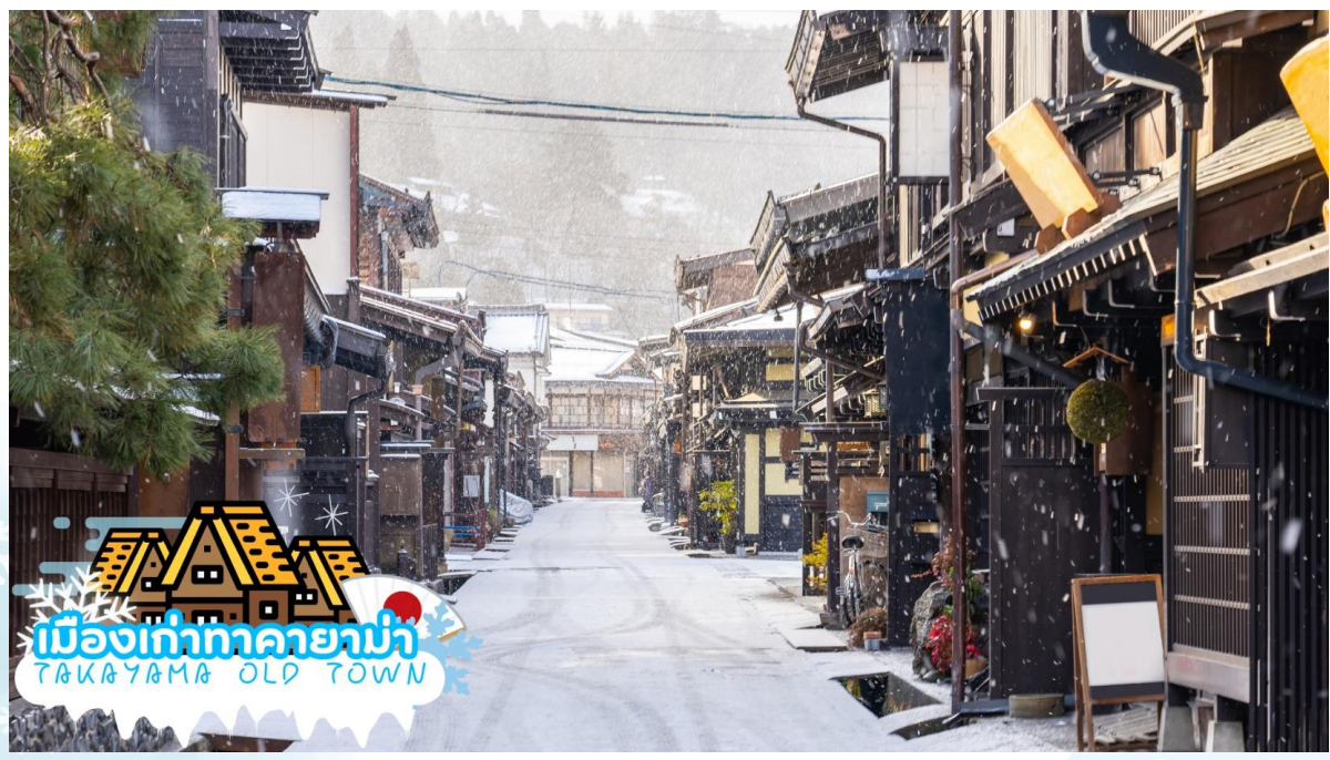
เมืองเก่าทาคายาม่า TAKAYAMA OLD TOWN

นำท่านเดินทางสู่ เมืองทาคายาม่า (TAKAYAMA) เป็นเมืองเล็ก ๆ ที่ตั้งอยู่จังหวัดกิฟุ ตัวเมืองมีสถานที่ท่องเที่ยวสำคัญ ๆ มีศิลปวัฒนธรรมและสถานปัตยกรรมแบบดั้งเดิมและมีธรรมชาติที่สวยงาม ทำให้ทาคายาม่าเป็นเมืองสวยอันดับต้น ๆ ของญี่ปุ่น