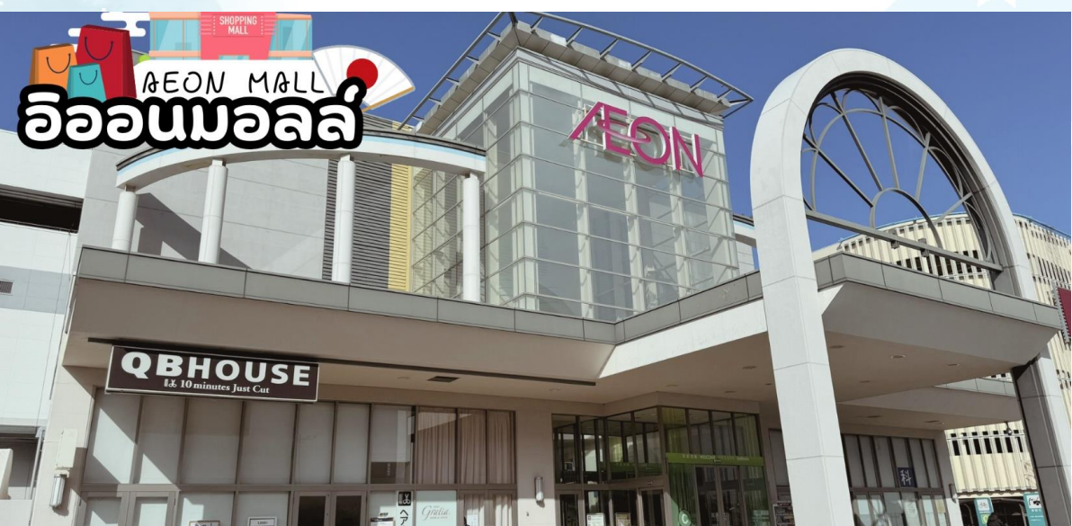
GO2NGO-TG090 -- TAKAYAMA TOYAMA OSAKA WINTER 6D 4N BY [TG]

นำท่านสู่ ศาลเจ้านัมบะ ยาชากะ (Namba Yasaka shrine) เป็นศาลเจ้าหัวสิงโตยักษ์ ด้วยความสูง 17 เมตร ศาลเจ้าแห่งนี้มีชื่อเสียงในฐานะจุดรับพลังงานศักดิ์สิทธิ์ ในอดีตนั้นสถานที่แห่งนี้มีความเฟื่องฟูจนถึงขีดสุด แต่ภายหลังจากการเกิดไฟไหม้ในช่วงสงครามจึงลดระดับความสำคัญลง แต่ก็มีการบูรณะเปิดใหม่อีกครั้งในภายหลัง โดยที่หัวสิงโตขนาดใหญ่ที่นับเป็นลักษณะของศาลเจ้าแห่งนี้ได้สร้างขึ้นในปี พ.ศ. 2518 เช่นเดียวกันกับสิ่งปลูกสร้างอื่น ๆ ที่มีการบูรณะขึ้นใหม่หลังได้รับความเสียหายเนื่องจากสงคราม ซึ่งมีความเชื่อว่าปากของสิงโตนั้นจะช่วยกลืนกินสิ่งที่ไม่ดี ปิดเป่าความชั่วร้ายให้หายไปและนำพาโชคลาภเข้ามา คนส่วนใหญ่ที่มาสักการะมักขอพรเรื่องการเรียนหรือด้านการทำงานให้เกิดความสำเร็จตามที่มุ่งหวัง