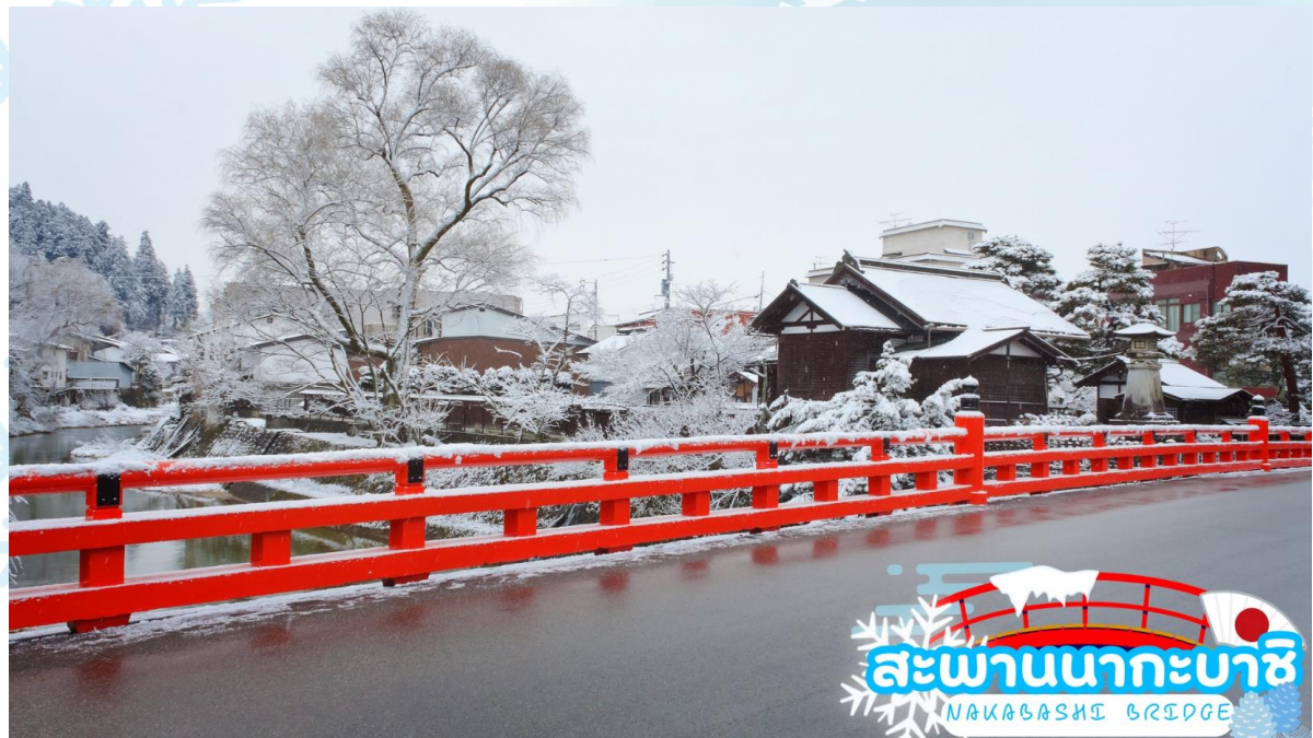
สะพานนาคะบาชิ NAKABASHI BRIDGE

สะพานนาคะบาชิ (Nakabashi Bridge) สะพานสีแดงของย่านเมืองเก่า สะพานทอดข้ามแม่น้ำมียากะวะที่ไหลผ่านใจกลางเมือง สะพานแห่งนี้ถือเป็นสัญลักษณ์ของเมืองทาคายาม่า