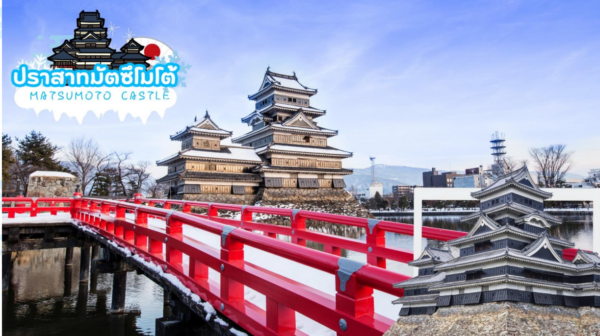
ปราสาทมัตสึโมโตะ MATSUMOTO CASTLE

นำท่านเที่ยวชมถ่ายรูป ด้านนอก ของ ปราสาทมัตสึโมโตะ (Matsumoto Castle) สร้างขึ้นมาราวศตวรรษที่ 16 - 18 ได้รับการขึ้นทะเบียนเป็นสมบัติชาติ พื้นที่ส่วนอื่น ๆ ภายในปราสาทก็ได้รับการขึ้นทะเบียนเป็นสถานที่ทางประวัติศาสตร์ของชาติ เป็นป้อมปราการที่ตั้งตระหง่านนี้ว่ากันว่าเป็นเท็นชูกาคูหลังคา 5 ชั้น พื้น 6 ชั้นที่เก่าแก่ที่สุดที่ยังหลงเหลืออยู่ในปัจจุบัน จุดเด่นของปราสาทมัตสึโมโตะอยู่ที่กำแพงสีดำของเท็นชูกาคู เลยมียชื่อเรียกว่า คาราซุโจ แปลว่า ปราสาทอึกา ตรงข้ามกับปราสาทฮิเมจิที่มีกำแพงสีขาว เลยมักเรียกว่า ชิราซากิโจ ปราสาทนกรกระยาง ให้ท่านได้เพลิดเพลินถ่ายรูปปราสาทโดยมีฉากหลังเป็นเทือกเขาแอลป์