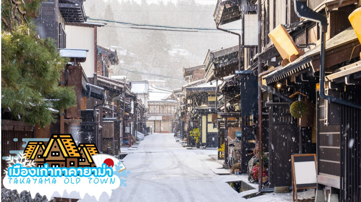
เมืองเก่าทาคายามา (Takayama Old town) หรือ ถนนซันมาจิซุจิ ซึ่งเป็นหมู่บ้านเก่าแก่สมัยเอโดะกว่า 300 ปีก่อน ที่ยังอนุรักษ์และคงสภาพเดิมได้เป็นอย่างดี อิสระให้ทุกท่านได้เดินเที่ยวและชื่นชมกับทัศนียภาพเมืองเก่าซึ่งเต็มไปด้วยบ้านเรือนโบราณ และร้านค้าหลากหลาย เช่น ร้านอาหาร ร้านขายของที่ระลึก ร้านงานศิลปะ