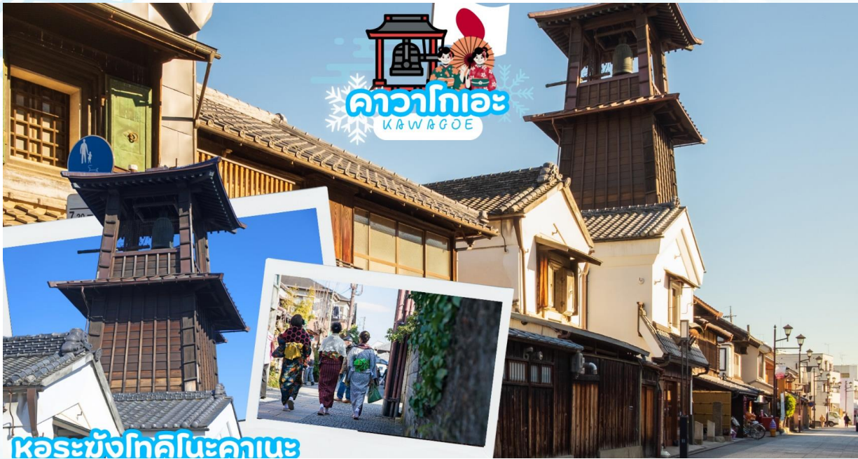
หอรบั้งโทคิโนะคานะ

เดินทางสู่ คาวาโกเอะ (Kawagoe) ได้รับการขนานนามว่าเป็นลิตเติลเอโดะ เพราะมีบรรยากาศที่มีความเป็นเมืองเก่าที่ได้กลิ่นอายโบราณทำให้รู้สึกเหมือนได้ย้อนยุค ได้สัมผัสบรรยากาศของโกดังเก่า ที่เรียงรายกันยาวตลอดระยะทางกว่า 700 เมตร ในสมัยก่อนเป็นสถานที่เก็บกักเสบียงอาหารเพื่อส่งไปให้เมืองเอโดะ (โตเกียวในปัจจุบัน) แต่ในปัจจุบันได้ถูกเปลี่ยนเป็นร้านค้า ร้านอาหาร ร้านขายของที่ระลึก ไม่ว่าจะเป็นร้านขนมที่ทำจากมันหวานสีเหลืองและสีม่วงอันเป็นผลิตภัณฑ์ขึ้นชื่อของเมืองนี้ สถานที่ท่องเที่ยวอันมีชื่อเสียงของเมืองคาวาโกเอะ