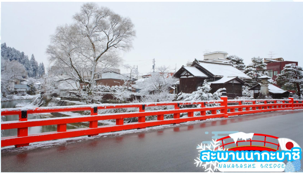
GO2HND-TG058 - TOKYO OSAKA TAKAYAMA ILLUMINATION WINTER 6D 4N BY [TG]