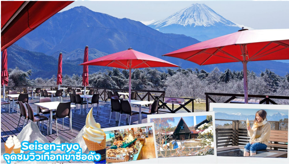
Seisen-ryo จุดชมวิวเทือกเขาชื่อดัง

เมืองโฮคุโตะ (Hokuto) ตั้งอยู่ทางตะวันตกเฉียงเหนือของจังหวัดยามานาชิ เป็นเมืองที่ล้อมรอบไปด้วยภูเขาสูง เช่น ภูเขาýtสี่งาตาเกะ เทือกเขาแอลป์ตอนใต้ ภูเขาคินปู และภูเขาคายะงาตาเกะนอกจากนี้ยังสามารถเห็นวิวที่สวยงามของภูเขาไฟฟูจิได้อีกด้วยมีทรัพยากรธรรมชาติที่มีคุณภาพ ไม่ว่าจะเป็นน้ำแร่ เมล็ดข้าว และผลิตภัณฑ์จากนมวัว