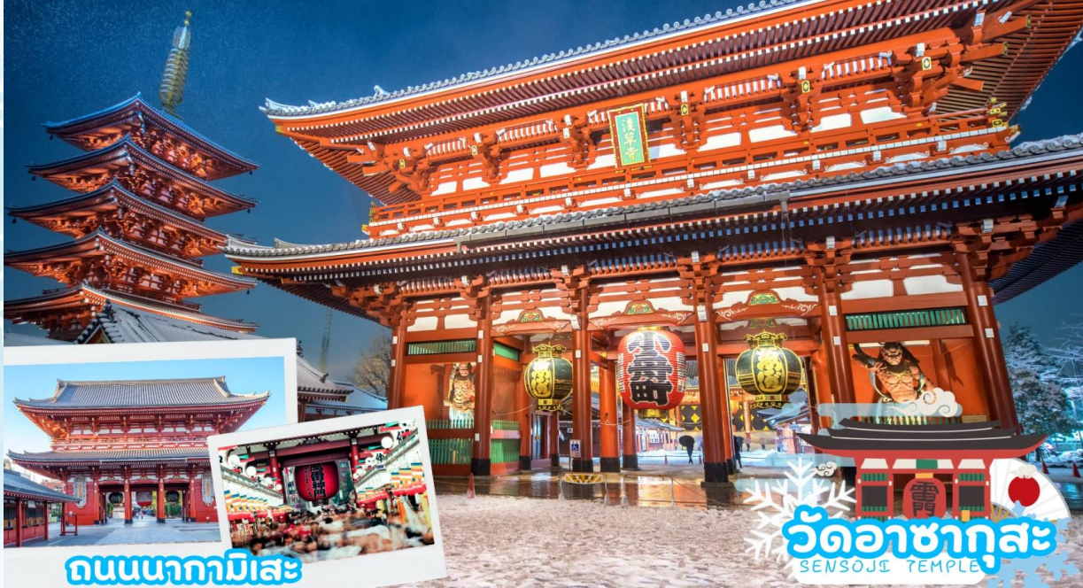
GO2HND-TG058 - TOKYO OSAKA TAKAYAMA ILLUMINATION WINTER 6D 4N BY [TG]

นำท่านเดินทางสู่ วัดอาซากุสะ (Asakusa) วัดที่เก่าแก่ที่สุดในกรุงโตเกียว ขอพรจากพระพุทธรูปเจ้าแม่กวนอิมทองคำ ท่านยังจะได้เก็บภาพประทับใจกับคอมไฟขนาดยักษ์ที่มีความสูงถึง 4.5 เมตร ซึ่งแขวนอยู่บริเวณประตูทางเข้าวัด และยังสามารถเลือกซื้อเครื่องรางของขลังได้ภายในวัด ฯลฯ หรือเพลิดเพลินกับ ถนนนากามิเสะ ถนนซอปปิงที่มีชื่อเสียงของวัด มีร้านขายของที่ระลึกมากมายไม่ว่าจะเป็นเครื่องรางของขลัง ของเล่นโบราณและตบท้ายด้วยร้านขายขนมที่คนญี่ปุ่นชื่นชอบ แม้กระทั่งองค์จักรพรรดิองค์ปัจจุบันยังเคยเสด็จที่วัดแห่งนี้