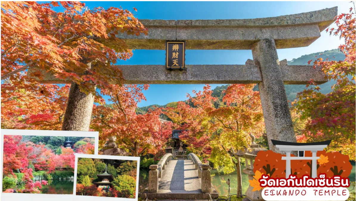
วัดเอกันโดเซ็นริน EIKANDO TEMPLE

นำท่านเดินทางสู่ วัดเอกันโดเซ็นริน (Eikando Temple) เป็นวัดพุทธศาสนานิกายโจโด (Jodo) หรือนิกายสุขาวดี ที่มีชื่อเสียงโด่งดังที่สุดในเกียวโต (Kyoto) ก่อตั้งขึ้นในปี ค.ศ. 863 ในช่วงสมัยเฮอัน เป็นวัดที่มี จุดชมใบไม้เปลี่ยนสีที่งดงามและโด่งดังที่สุดในเกียวโต จนได้รับฉายาว่า เอคันโดแห่งใบเมเปิ้ล ต้นเมเปิ้ลปกคลุมไปทั่วบริเวณวัดมากถึง 3,000 ต้น โดยใบไม้จะร่วงเต็มสวนในช่วงฤดูใบไม้ร่วง และถูกย้อมสีแดงและสีเหลืองผสมกัน แต่งแต้มสีสรรไปทั่วบริเวณสวน ภายในบริเวณของวัดกว้างขวางและมีจุดถ่ายรูปสวยๆ หลายมุม เช่น จุดถ่ายรูปยอดนิยมนที่มีสะพานโค้งและเงาสะท้อนของใบเมเปิ้ลสีแดงฉานบนผิวน้ำเจดีย์ทาโฮโต ( การเปลี่ยนสีของใบไม้ในฤดูใบไม้ร่วง ขึ้นอยู่กับสภาพอากาศ )