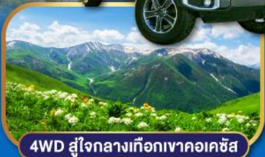
4WD สู่ใจกลางเทือกเขาคอเคซัส