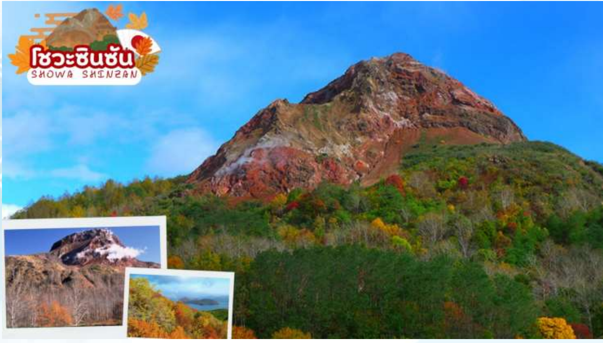
GO2CTS-TG076-- HOKKAIDO HAKODATE TOYA AUTUMN IN WINTER 6D 4N BY TG

จากนั้นนำท่านเดินทางสู่ ภูเขาไฟโชวะชินซัน (Showa Shinzan) ซึ่งมีอนุสาวรีย์บุรุษไปรษณีย์ผู้ค้นพบความเคลื่อนไหวและการเกิดขึ้นมาใหม่ของภูเขาไฟเกิดใหม่ประมาณปี ค.ศ.1944 -1945 ภูเขาไฟนี้เองใหม่ที่เกิดจากการสั่นสะเทือนของผิวโลกในปี 1946 ซึ่งระเบิดปะทุติดต่อกันนานถึง 2 ปีจนกลายมาเป็นภูเขาโชวะชินซัน ดังที่เห็นอยู่ปัจจุบันอยู่ในความดูแลของรัฐบาลในฐานะเป็น “อนุสรณ์ทางธรรมชาติแห่งพิเศษ”