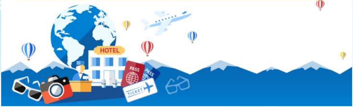
GO2CTS-TG076-- HOKKAIDO HAKODATE TOYA AUTUMN IN WINTER 6D 4N BY TG

บริษัทฯ ขอสงวนสิทธิ์ที่จะไม่คืนค่าทัวร์ ไม่ว่างกรณีใดๆ *สำคัญ !! บริษัททำธุรกิจเพื่อการท่องเที่ยวเท่านั้น ไม่สนับสนุนการเดินทางเข้าญี่ปุ่นโดยผิดกฎหมาย ลูกค้านำต้องผ่านการตรวจคนเข้าเมืองด้วยตัวของตัวเอง โดยมัคคุเทศก์ไม่สามารถช่วยเหลือใดๆได้ทั้งสิ้น *