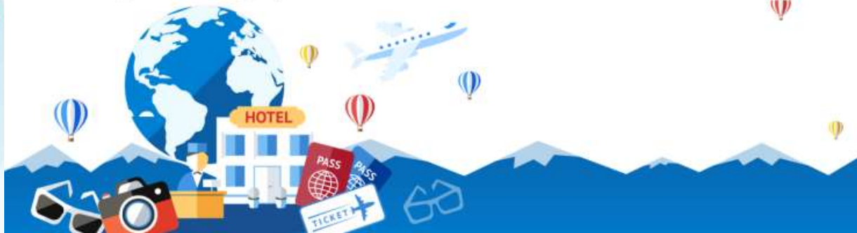
GO2CTS-TG076-- HOKKAIDO HAKODATE TOYA AUTUMN IN WINTER 6D 4N BY TG