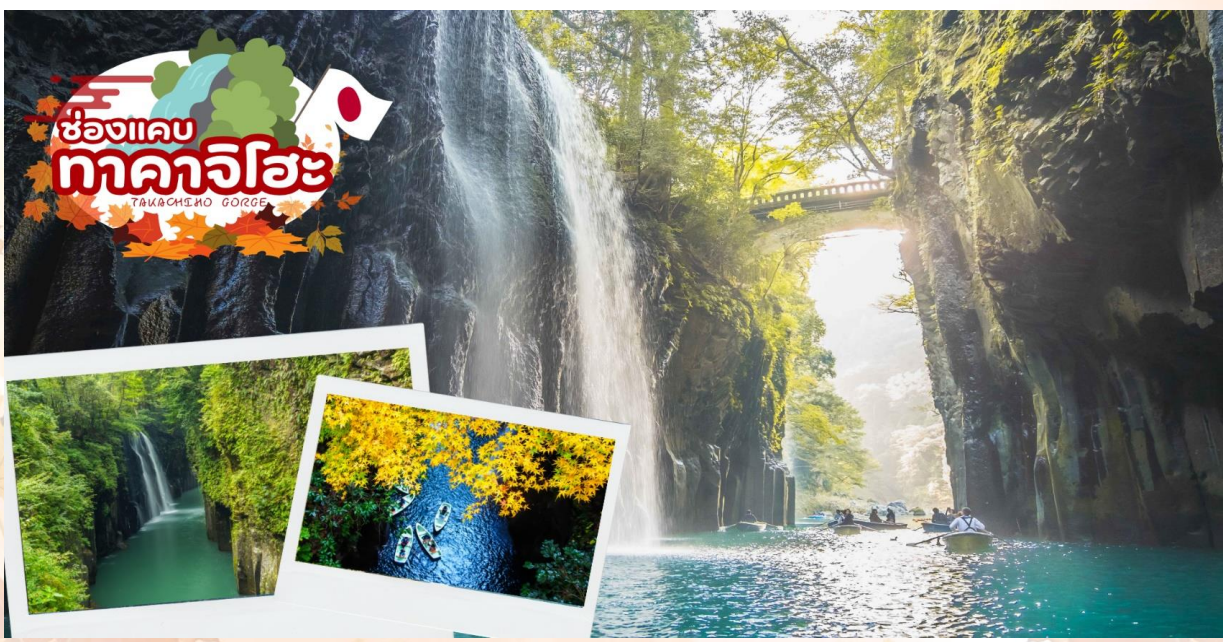
GO2FUK-TG033 – KYUSHU SAGA KUMAMOTO TAKACHIHO 6D 4N

ช่องแคบทาคาจิโฮะ (TAKACHIHO GORGE) ช่องแคบนี้อัศจรรย์เป็นรูปตัววีซึ่งเกิดจากการที่แม่น้ำโกคาเสะถูกลาวาที่ปะทุขึ้นมาจากภูเขาไฟอะโสะกัดเซาะจนเกิดเป็นช่องแคบนี้ขึ้นมา ให้ท่านได้ชมความงดงามของทิวทัศน์ และถ่ายรูปคู่กับไฮไลท์ของช่องแคบทาคาจิโฮะ คือ "น้ำตกมานาอิ" ที่นักท่องเที่ยวนิยมถ่ายรูปเป็นมูฮิตเมื่อได้มาเยือน