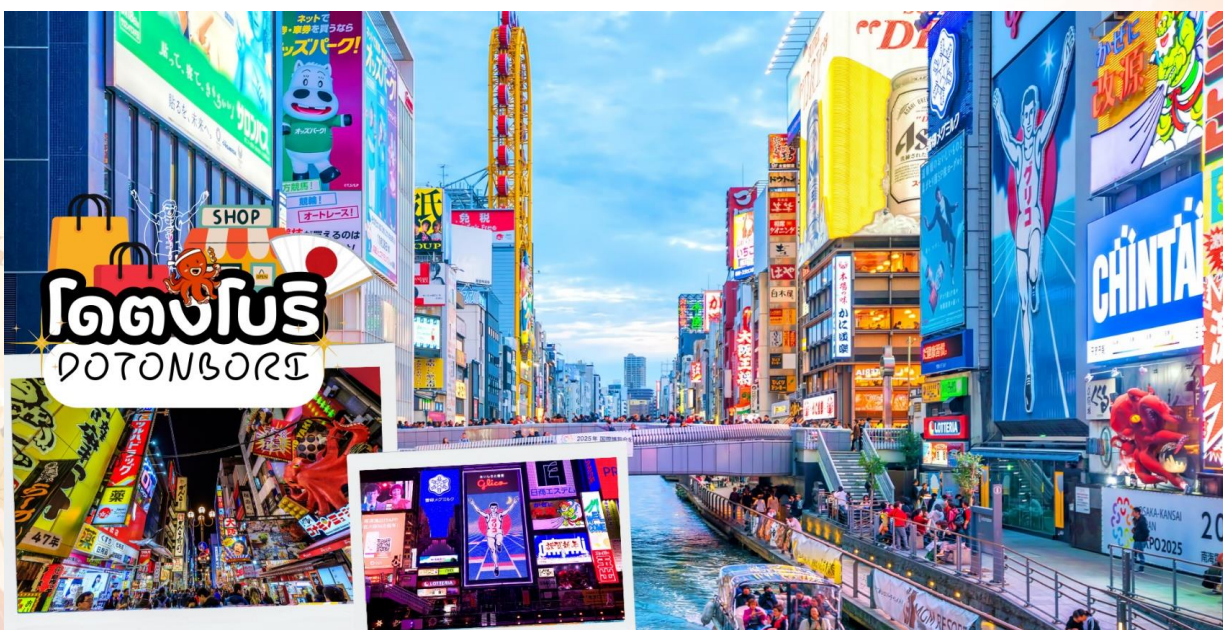
GO2FUK-TG035 – EXPERIENCE UNSEEN CHUGOKU KYOTO OSAKA 7D 5N

พาท่าน ช้อปปิ้งโดตงโบริ (Dotonbori) นั้น ถือว่าเป็นแหล่งช้อปปิ้งที่มีชื่อเสียงมากที่สุดในจังหวัดโอซาก้า และยังถือเป็นแหล่งช้อปปิ้งที่มีความโรแมนติกอีกด้วย เพราะย่านโดตงโบริที่เป็นแหล่งช้อปปิ้งนั้น ไม่ได้มีขนาดใหญ่เหมือนกับแหล่งช้อปปิ้งที่อื่นๆ จะเป็นเพียงถนนสายเล็กๆ ที่อยู่เลียบบคลองโดตงโบริ ในช่วงเย็นๆของถนนสายนี้จะดูคึกคัก เต็มไปด้วยแสงสี และเสียงจากป้ายไฟโฆษณาต่างๆ ที่อยู่ทั้งบนตึกและริมแม่น้ำ ผู้คนส่วนใหญ่ที่เป็นนักท่องเที่ยวต่างชาติ และชาวญี่ปุ่นเอง จะมาเดินช้อปปิ้ง มาทานอาหารเพื่อตีความกับบรรยากาศแบบนี้กันเป็นจำนวนมาก จุดที่พลาดไม่ได้ ของย่านโดตงโบรินี้ ก็คือ ป้ายไฟกูลิโกะ ซึ่งเป็นที่รู้จักกันอย่างมากมายบริเวณสะพานเอบิซุ