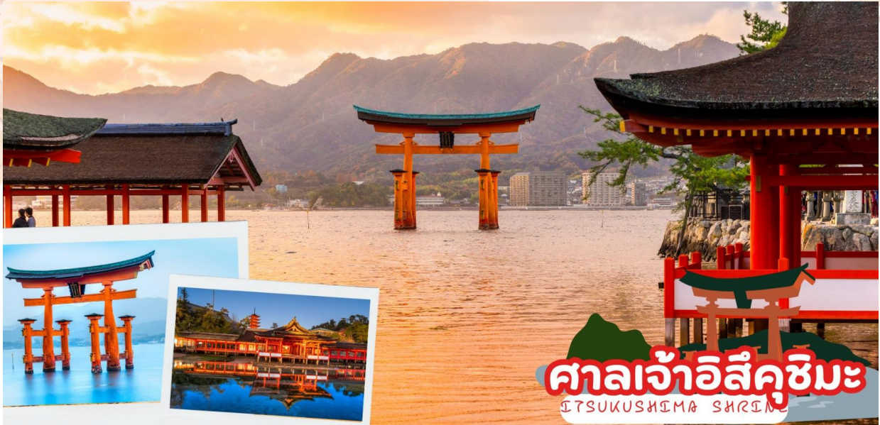
ศาลเจ้าอิสึคุชิมะ ITSUKUSHIMA SHRINE

ศาลเจ้าจะเหมือนเรือขนาดยักษ์ที่ลอยน้ำอยู่ ศาลเจ้าแห่งนี้ได้รับการขึ้นทะเบียนเป็นมรดกโลกในปี พ.ศ. 2539 และรัฐบาลญี่ปุ่นได้ยกฐานะให้เป็นสมบัติประจำชาติ