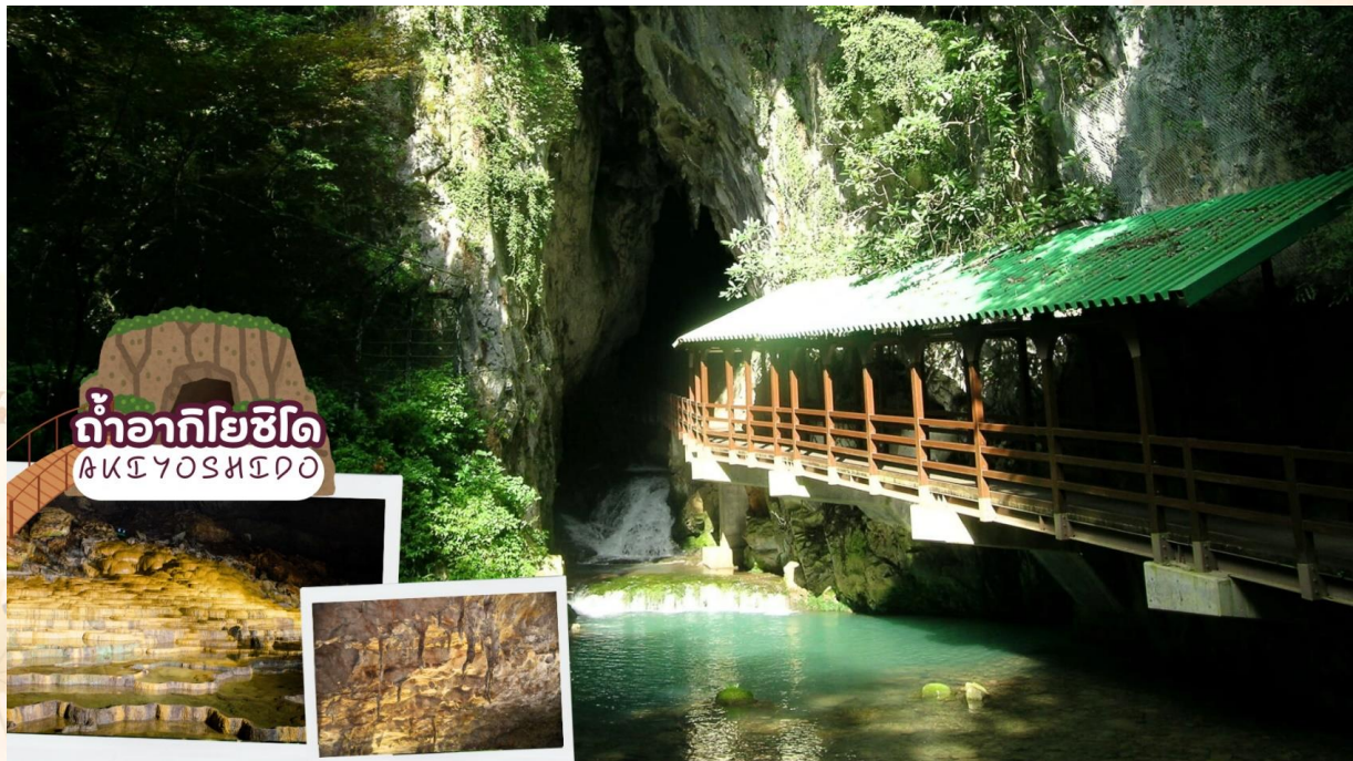
GO2FUK-TG035 – EXPERIENCE UNSEEN CHUGOKU KYOTO OSAKA 7D 5N

ถ้ำอากิโยชิโด (Akiyoshido) คือ หนึ่งในถ้ำหินปูนชั้นนำขนาดใหญ่ของญี่ปุ่น อยู่ที่บริเวณเชิงเขาอากิโยชิโด ทางเข้าถ้ำสูง 20 เมตร. และกว้าง 8 เมตร. พื้นที่กว้างที่สุดภายในถ้ำคือ 200 ม. และอุณหภูมิภายในถ้ำจะคงที่ที่ 17°C ตลอดปี หมายความว่า เป็นอากาศที่สบายสำหรับการท่องเที่ยวสำรวจถ้ำ จากนั้นก็เริ่มต้นเดินทางเข้าไปในถ้ำเพื่อชมธรรมชาติของหินปูนที่ก่อตัวขึ้นอย่างใกล้ชิดได้แบบสบายๆ