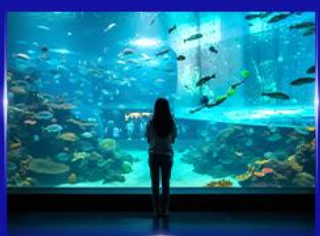
อควาเรียมยักษ์รูปเต่า