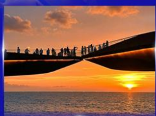
สะพานจูบ Sunset Town