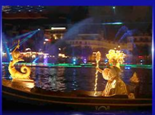
ชมโชว์เวนิสจำลอง แกรนด์วิลด์