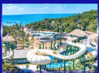
สวนสนุก Sun world Hon thom