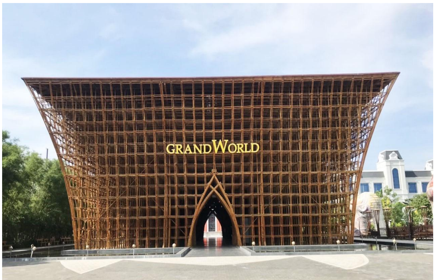
ชมการแสดงโชว์สุดอลังการ THE CORLOUR VENICE กลางแจ้งที่จัดแสดงทุกวัน วันละ 1 รอบ ใจกลางเมือง GRAND WORLD